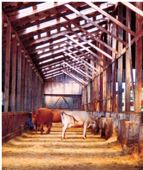
Vabapidamislaud Saaremaal Riido talus

Kevadel, kui loomad hakkavad ereda päikesega väljas käima, võib udara õli või võiga sisse määrada, nii ei saa udar päikesepõletust ega lähe valulikuks.