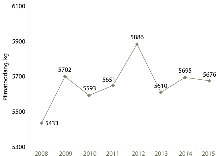
Joonis 1. Keskmine piimatoodang aastalehma kohta Eesti jõudluskontrolli all olevates mahefarmides, kus oli vähemalt 10 lehma (2008-2015).

oli ainult seitsmes mahetalus lehmade keskmine piimatoodang üle 6000 kg (sh kahes talus oli see üle 8000 kg). EPJ andmetel andis 2013. a üks mahelehm 12 382 kg piima, mida võib mahelehmade hulgas pidada tänaseni ametlikuks Eesti rekordiks.