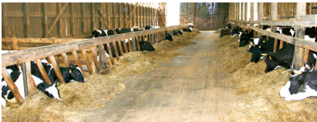
Vabapidamislaud Pärnumaal Mätiku talus

Kui ettevõttes alustatakse mahepõllumajandusliku veisekasvatust koos mahepõllumajandusliku taimekasvatusega, siis saab piima mahesaadusena müüa kahe aasta pärast. Kui üleminekut mahepiimatootmisele alustatakse ettevõttes, kus taimekasvatus on üleminekuaja mahepõllumajandusele läbinud, tuleb selleks, et piima saaks mahesaadusena müüa, loomi eelnevalt pidada mahepõllumajanduse nõuete kohaselt vähemalt 6 kuud.