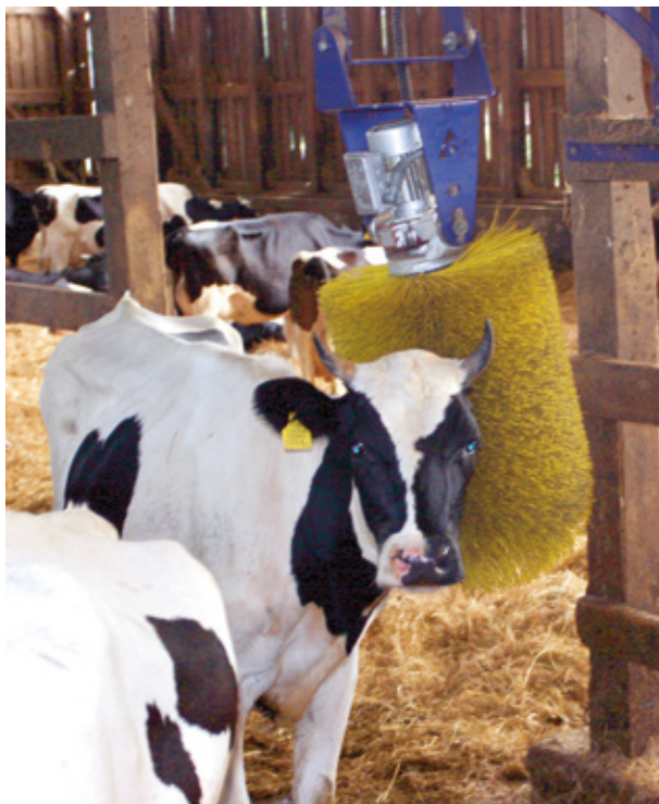
Automaatselt käivituvad harjad Mätiku talu laudas

Lautu, sulgusid, seadmeid ja riistu peab puhastama ja desinfitseerima, et vältida nakkuste levikut ning haigusekandjate tekkimist. Kasutada võib üksnes määruse (EÜ) nr 889/2008 VII lisas loetletud tooteid. Putukate ja muude kahjurite hävitamiseks võib kasutada sama määruse II lisas loetletud tooteid. Rodentitsiide võib kasutada ainult lõksudes.