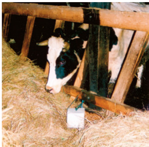
Kui lakukivi jaoks pole spetsiaalset hoidjat, kinnitatakse see jämeda nõõriga

Alati on vajalik juurdepääs värsketele veele ja mineraalsöödale.