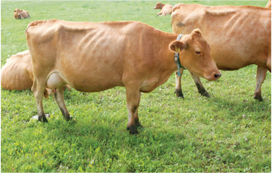
Eesti maakarja tõugu veis

punase tõuga. Viimase kümne aasta jooksul on eesti punase karja aretuses kasutusele võetud mitu eri tõugu, nagu sviitsi, rootsi punane, norra punane, ääršir ja punasekirju holstein, mistõttu punase lehma värvus varieerub helepruunist kuni punase-valgekirjuni. Põhiliseks aretusmaterjaliks on ikkagi jäänud taani punane tõug. Selle tulemusel on aretatud uut tüüpi eesti punane tõug, kellel on hea piimajõudlus, tugevad jalad, hea tervis ja tüüp. Piimatoodang on eesti punasel karjal veidi väiksem kui eesti holsteinil, kuid rasva- ja valgusisaldus piimas pisut suurem. Samuti on eesti punasel karjal tugevam tervis ja paremad viljakuse näitajad. Seetõttu on ta ka maheproduktide hästi sobiv tõug.