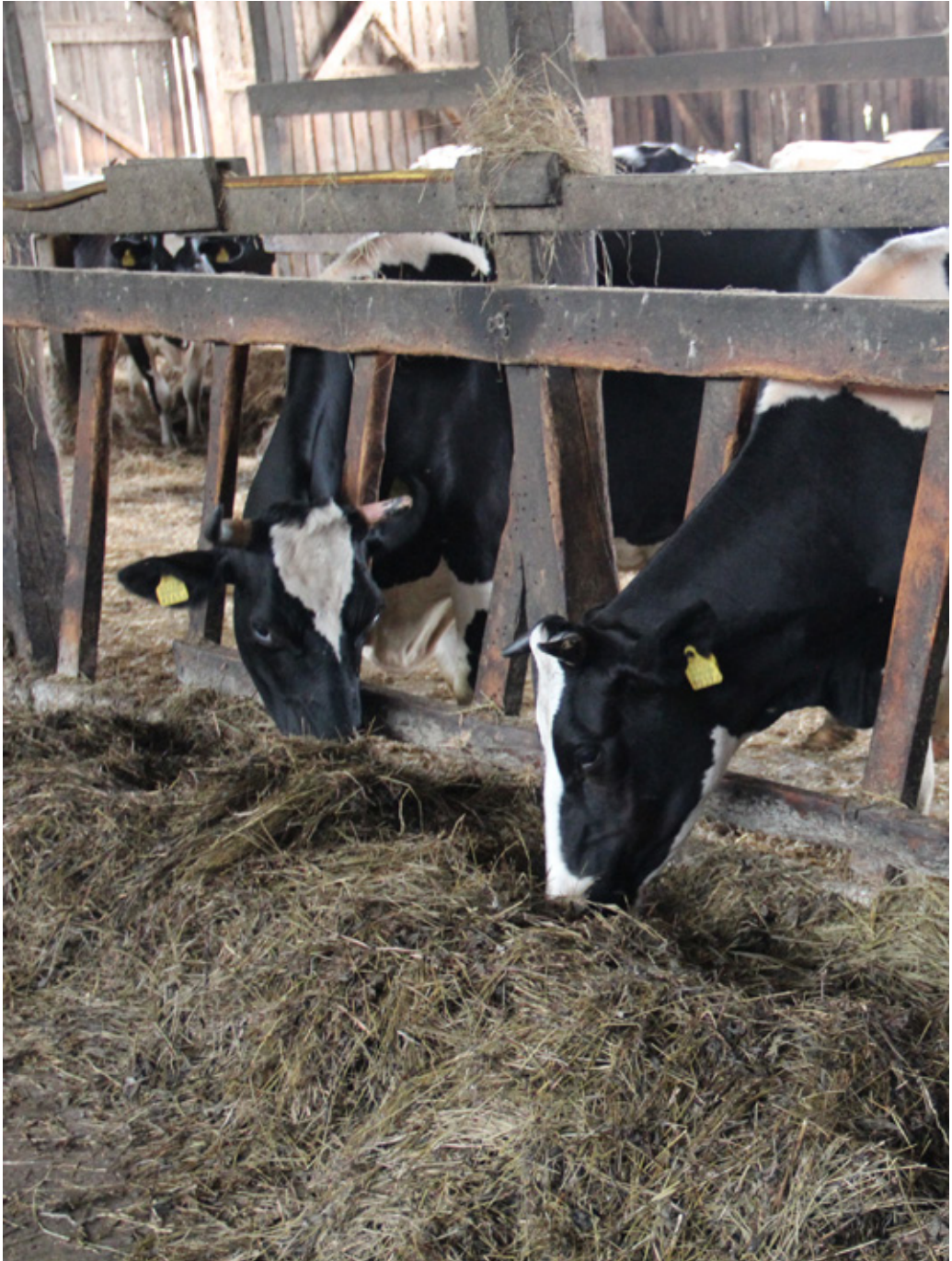
Mahetootmises on levinuim tõug eesti holstein