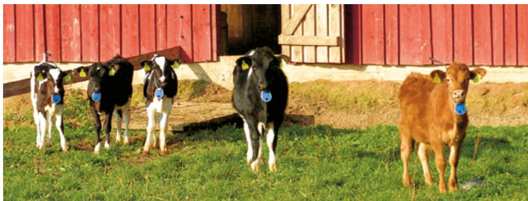
Noorloomad Pajumäe talus

Nii nagu lehmade söötmisel, tuleb ka vasikate ja mullikate söötmisel lisaks orgaanilistele söötadele anda mineraalsööta ja keedusoola.