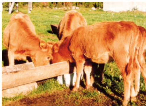
Eesti maakarja tõugu vasikad