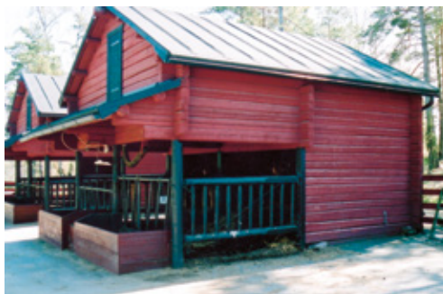
Müügiks minevate loomade jaoks ehitatud hoone Soome lihaveisekasvatuses

Mahetallu tuleb sisse osta maheloomi. Kui maheveiseid ei ole saada, võib karja uuendamiseks maheettevõttesse tuua loomi ka mittemahepõllumajanduslikest karjadest: täiskasvanud isasloomi; esmapoegimata emasloomi kuni 10% senisest täiskasvanud veiste arvust aastas või kui ettevõttes peetakse kuni 10 veist, siis ühe looma