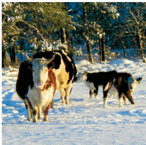
Lihaveised tunnevad ennast talvel väljas hästi

Eesti Maaülikooli 2010. a tehtud uuringus „Loomade heaolu ja loomade tervishoid mahepõllumajanduses“ leiti, et loomadel, keda peeti aasta ringi ilma loomapidamishooneta, oli vähem