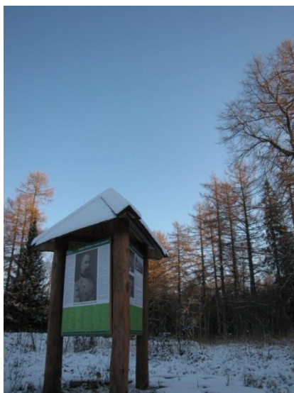
Joonis 34. Isabella puhkekoht. Jüri Pere (RMK Loodusega koos 2016 k )

Info: Isabella puhkekoht (Joonis 34.) on RMK Hiiumaa puhkekoht.