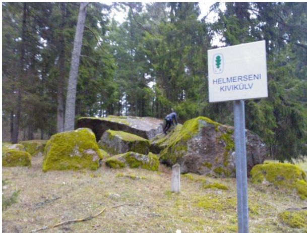
Joonis 3. Helmerseni kivikülv. 27.02.15

Info: Helmerseni kivikülv (Joonis 3.) on 0,5 ha suurusel maa-alal üle 80 asuva kivi, mida jää on sinna kandnud.