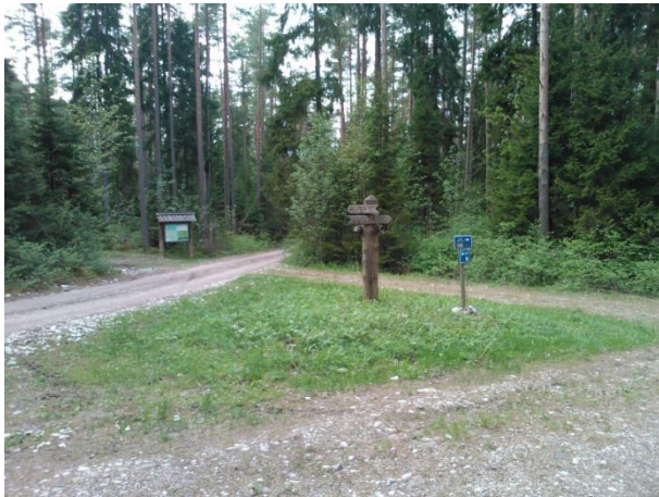
Joonis 45. Neljateeristi õpperada. 16.05.16

Turundus: Puhkaestis.ee lehel puudub. Hiiumaa 2016. a turismikataloogi kaardil leppemärgiga märgitud. RMK Loodusega koos lehel olemas.