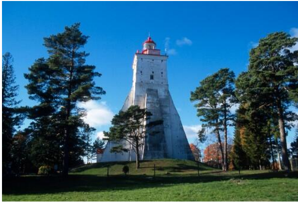
Joonis 28. Kõpu tuletorn. Tiit Leito (Tuletorni ring 2004 a )

Info: Kõpu tuletorn (Joonis 28.) on maailmas vanuselt kolmas pidevalt tegutsev tuletorn.