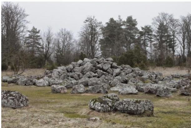
Joonis 2. Põhilise leppe kivid. Helena Kivi. 27.02.15

Info: Põhilise leppe kivid (Joonis 2.) on 3 m kõrgune ja 16 m läbimõõduga graniitkividest hunnik.