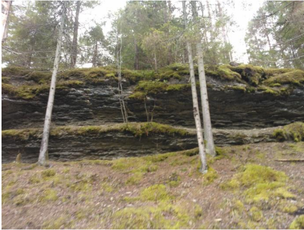
Joonis 15. Kallaste pank. 27.02.15

Seisukord: kuivkäimla, 2 infotahvliit, trepp panga alla, 300 m kooremultšiga kaetud rada pangani (RMK Loodusega koos 2016 b ).