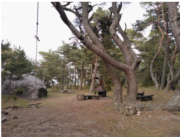
Joonis 43. Mägipä telkimisala. 16.05.16

Info: Mägipä telkimisala (Joonis 43.) on RMK Hiiumaa puhkeala objekt. Telkimisala on kõrvuti Kalurikoja metsaonniga.