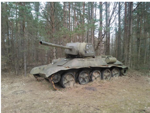
Joonis 31. Tanki makett Tahkuna teel. 14.03.2016

Asukoht: riigimaa, Tahkuna militaarrajatised (Joonis 31.) asuvad Tahkuna poolsaarel, Hiiu vallas, Tahkuna looduskaitsealal.