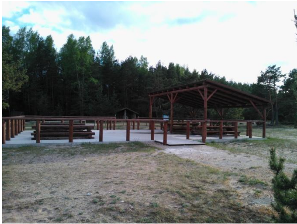
Joonis 33. Vaade Hirmuste puhkekoha taristule. 16.05.16

Info: Hirmuste õpperada ja telkimisala (Joonis 33.) on RMK Hiiumaa puhkeala objektid. Mere ääres männimetsa varjus asuv kauni liivarannaga telkimiskoht (RMK Loodusega koos 2016 j ). 1,3 km pikkune rada kulgeb läbi lodulepiku ja üle metsastunud luidete vanas loodusmetsas (RMK Loodusega koos 2016 i ).