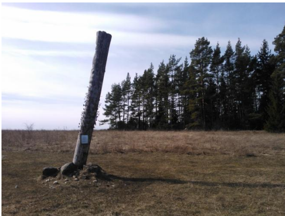
Joonis 27. Tubala vai. 02.04.2016

Info: Tubala vai (Joonis 27.) löödi maasse 28.07.2003, kannab muistset mõtet, kuid ühtlasi mõeldud toetama kogu Hiiumaa kultuuri (Puhka Eestis 2016 e ).