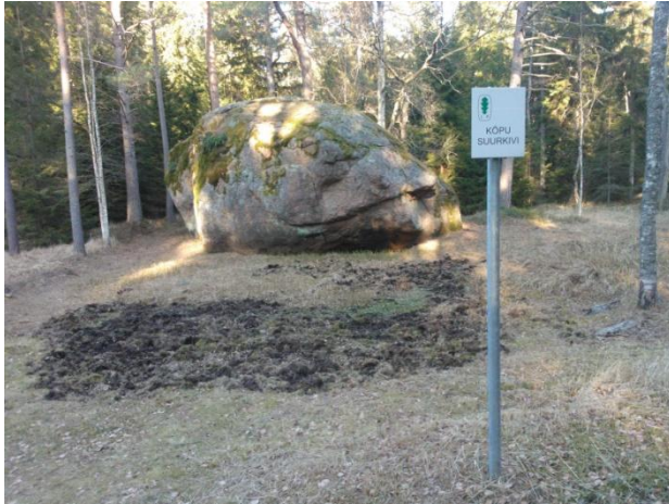
Joonis 4. Kõpu suurkivi. 19.03.15

Info: Kõpu suurkivi (Joonis 4.) nimetatakse veel Lepistepao suurkiviks. Hiiumaa suuruselt teine, aga kõrguselt esimene rändrahn