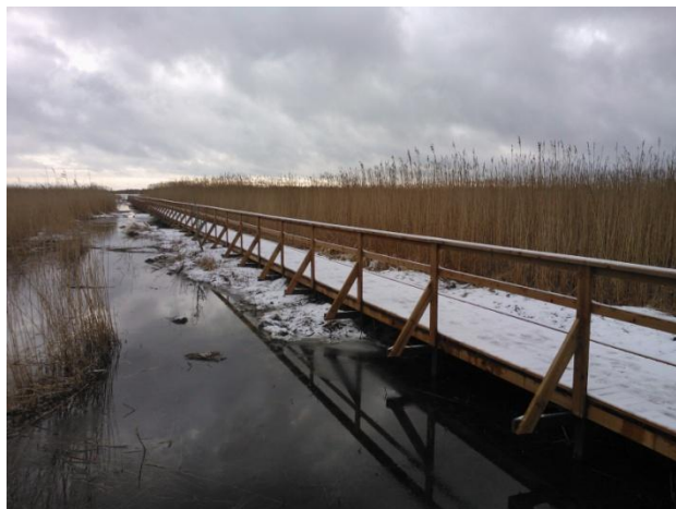
Joonis 20. Orjaku õpperaja roostikuring. 27.02.16

Turundus: Orjaku linnuvaatlustorn ja õpperada (Joonis 20.) on puhkaeestis.ee lehel olemas, Hiiumaa 2016. a turismikataloogi kaardil kirjas. Hiiumaa vaatamisväärsuste kaardil linnuvaatlustorn olemas.