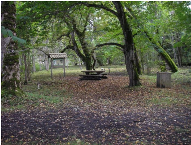
Joonis 13. Suuremõisa park. Andres Miller. 29.09.09 (Keskkonnaamet 2016 6 )

Info: Suuremõisa park (Joonis 13.) on Suuremõisa lossi ümbrusesse rajatud haljasala, mis on Hiiumaa suurim park ja looduskaitse all.