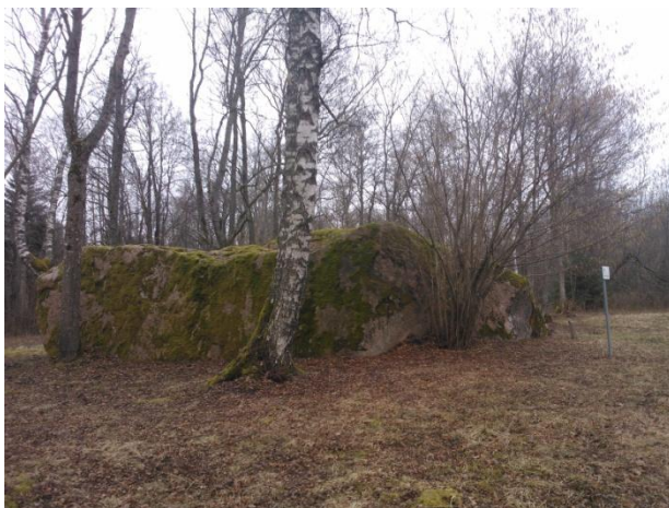
Joonis 1. Kukka kivi. 19.03.15

Info: Kukka kivi (Joonis 1.) on Hiiumaa suurim ja Eestis suuruselt 5. rändrahn (Leito 2007).