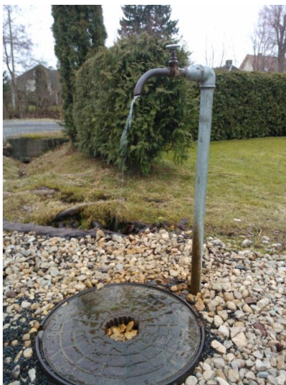
Joonis 7. Arteesia kaev Aia ja Pika tänava nurgal. 28.02.15

Turundus: Kärdla arteesia kaevud (Joonis 7.) on puhkaestis.ee lehel olemas, Hiiumaa 2016. a turismikataloogi kaardil leppemärgiga märgitud.