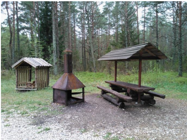
Joonis 32. Autobaasi lõkkekoht. 15.05.16

Info: Autobaasi lõkkekoht (Joonis 32.) on RMK Hiiumaa puhkekoht.