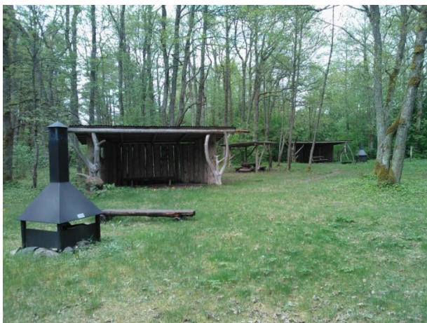
Joonis 42. Luidja telkimiskoht. 16.05.16

Info: Luidja telkimisala (Joonis 42.) on RMK Hiiumaa puhkeala objekt.