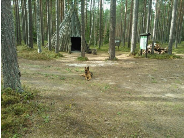
Joonis 41. Leemeti püstkoda. 15.08.13

aga ligipääs on hea (RMK Loodusega koos 2016 5 ).