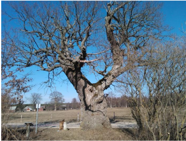
Joonis 5. Tärkma ohvritamm. 19.03.15

Ligipääs: asub kruusatee ääres, kuhu tuleb ka auto jätta. Parklat pole. Objekti oli raske leida, sest Emmaste asula suure tee peal viita pole. Viit on alles asulast Tärkma külasse sisse sõites.