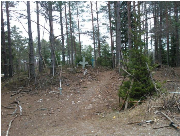
Joonis 26. Ristimägi. 28.02.15

Info: Ristimägi (Joonis 26.) on ristidega kaetud ala maantee ääres, mille kujunemise kohta on seos Reigi rootslaste väljasaatmisega 1781. aasta augustis (Põllo 2004).