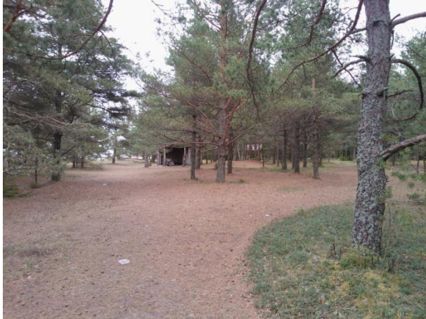
Joonis 47. Palli telkimisala. 16.05.16

Seisukord: ruumi 25 telgile, infotulp, infoalused, kuivkäimla, küttekoldega varikatusealune, kaetud lõkkekoht, grillimisrestidega lõkkekohad (RMK Loodusega koos 2016 ä ; RMK Loodusega koos 2016 ö ).