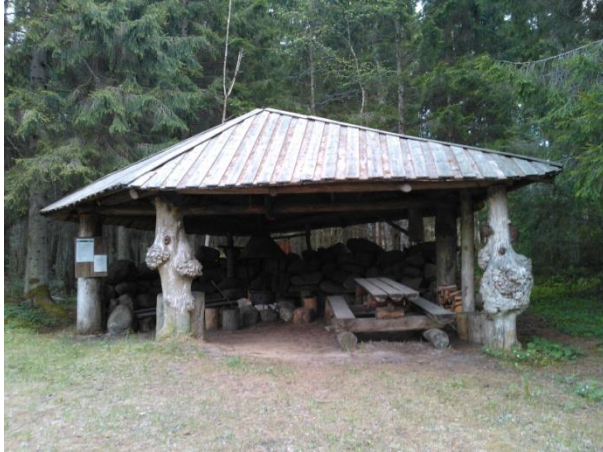
Joonis 40. Laasimetsa lõkkekoht. 16.05.16

Ligipääs: lõkkekoht asub Hüti-Käina tee ääres, Hütist 3,5 km Käina poole, vasakul pool vahetult sõidutee ääres. Olemas ka viit, mis suunab RMK puhkekohta. Parkimine metsatee servas lõkkekoha kõrval (RMK Loodusega koos 2016 s ).