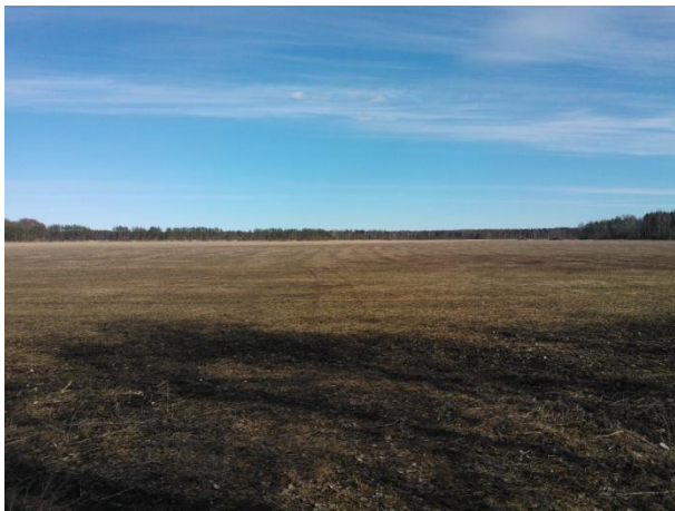
Joonis 19. Vaade Kärdla meteoriidikraatritele. 02.04.16

Info: Kärdla meteoriidikraater (Joonis 19.) on Eesti suurim iidne meteoriidikraater maismaal.