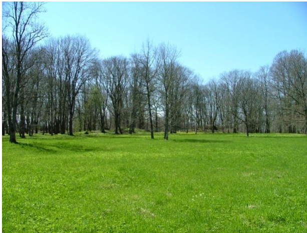
Joonis 14. Vaemla park. J. Vali. 11.05.05 (Kultuurimälestiste riiklik register 2016)

Info: Vaemla park (Joonis 14.) on rajatud arvatavasti 19. sajandi II poolel inglise stiilis, osa sellest oli pargiilmeline viljapuuaid (Keskkonnaamet 2016 a ).