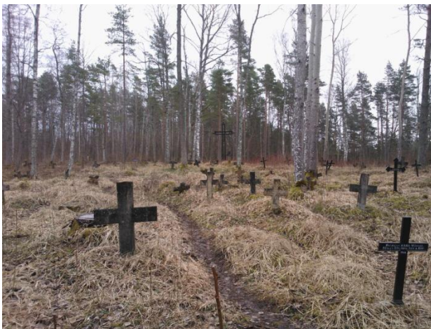
Joonis 25. Kummistu kalmistu. 27.02.15

Info: Kummistu kalmistu (Joonis 25.) on ajaloomälestis, kus matmine lõpetati 20. sajandi algul ruumi puuduse tõttu.