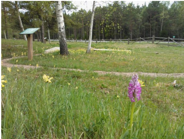
Joonis 39. Kõrgessaare orhideede õpperada. 16.05.16

Turundus: Kõrgessaare orhideede õpperada (Joonis 39.) on Puhkaestis.ee lehel olemas, Hiiumaa 2016. a turismikataloogis puudub. RMK Loodusega koos lehel olemas.