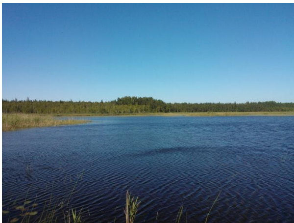
Joonis 16. Tihu järv. 06.07.13

Info: Tihu järved (Joonis 16.) on järvestik Kesk-Hiiumaal, kus kolm järjestikust järve paiknevad loode-kagusuunalises vagumuses (Vikipeedia 2015). Läheduses asuvad Tihu metsaonn ja 1,2 km pikkune õpperada kuuluvad RMK Hiiumaa puhkealale.