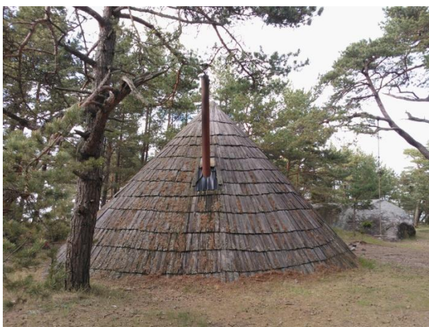
Joonis 36. Kalurikoja metsaonn. 16.05.16

Info: Kalurikoja metsaonn (Joonis 36.) on RMK Hiiumaa puhkeala objekt. Metsaonn on kõrvuti Mägipä telkimisalaga.