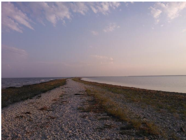
Joonis 17. Sääretirp. 06.08.14

Info: Sääretirp (Joonis 17.) on kirde-edela suunaline maanina, mis kaob merre kiviklibuse säärena (Hiiumaa Turismiliit 2015). Sääretirbil asub ka RMK telkimisala.