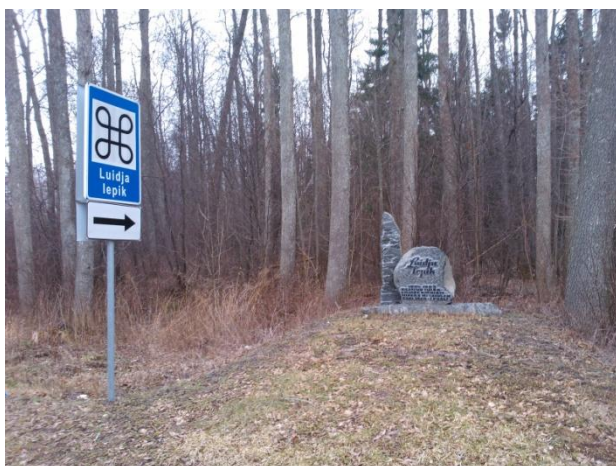
Joonis 23. Luidja lepiku mälestuskivi. 28.02.15

Ligipääs: Kärkla-Kõpu asfalteeritud tee ääres, parkimine tee pervele. Parkla puudub. Viidastatud.