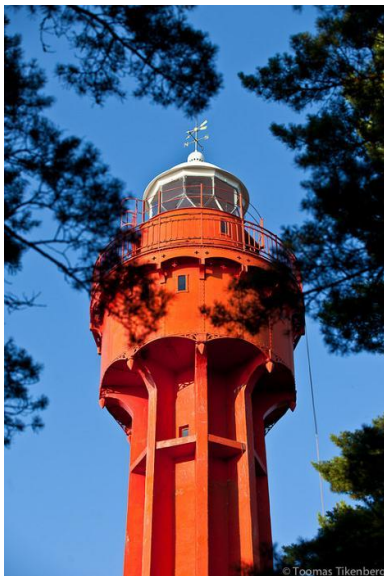
Joonis 30. Ristna tuletorn.