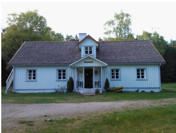
Joonis 48. Ristna looduskeskus ja teabepunkt. Autori foto. 16.05.16

Info: Ristna looduskeskus, õpperada ja teabepunkt (Joonis 48.) on RMK Hiiumaa puhkeala objektid. Õpperada 1,5 km pikkune (RMK Loodusega koos 2016 ü ). Ristna looduskeskus on RMK Hiiumaa puhkeala keskus (RMK Loodusega koos 2016 x ).