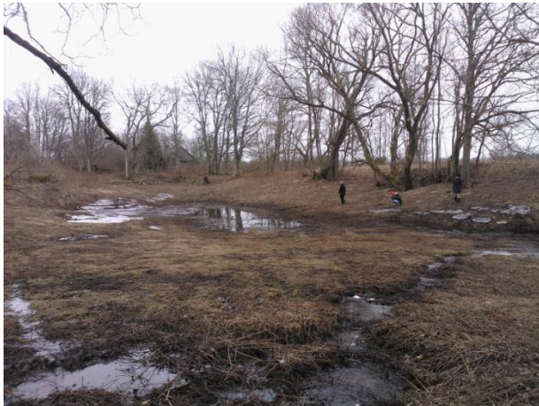
Joonis 8. Kurisoo neeluauk. 28.02.15

Info: Kurisoo neeluauk (Joonis 8.) on looduskaitseline objekt, karstivorm.