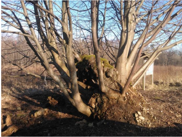
Joonis 6. Ülendi niinepuu. Autori foto. 19.03.15

uskumatud lood kunagistest pühapaikadest.