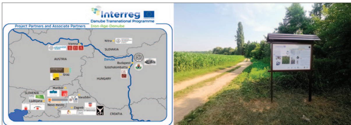
Sl. 1 Partneri projekta Iron-Age-Danube i jedna od informativnih dvojezičnih tabli arheološko-turističke staze postavljene na Bistričaku u okviru projekta Iron-Age-Danube Interreg DTP u 2019.