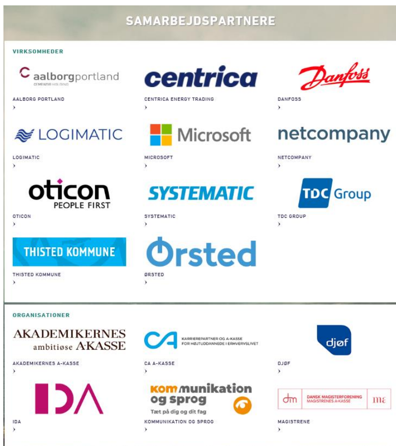
Figur 5 Et udvalg af universitetets samarbejdspartnere ( https://www.karriere.aau.dk/samarbejdspartnere/ ).

Kontrakten mellem virksomheden, universitetet og den studerende er juridisk bindende. Den indeholder bestemmelser om arbejdstid per uge, evt. transportgodtgørelse, en udtalelse fra virksomheden til den studerende ved praktikens slutning, at virksomheden/organisationen skal tildele den studerende en kontaktperson, som den studerende kan rådføre sig hos vedr. professionelle og praktiske spørgsmål, at den studerende skal overholde virksomhedens/organisationens regler for arbejdstider, arbejdsprocedurer og fortrolighed, og om de økonomiske vilkår generelt.