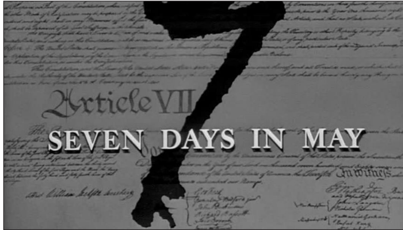
Abb. 3: Die doppelte symbolische Ordnung in SEVEN DAYS IN MAY.