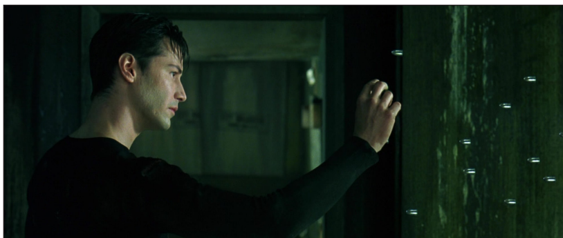
Abb. 5: In THE MATRIX (US 1999, Regie: Andy Wachowski und Larry Wachowski) durchschaut und kontrolliert der selbst allmächtig gewordene Protagonist die – freilich nur simulierte – Wirklichkeit.

Während das Paranoia-Kino der 1970er-Jahre also letztlich von einem obszönen Staat erzählte, der sich nicht mehr an seine eigenen Regeln hält und das Individuum mithin einem paradox entregelten Gesetz der Gesetzlosigkeit unterwirft, ist das Verschwörungdenken der Gegenwart darauf ausgerichtet, »aus jedem Einzelnen das symbolische Abbild des Staates« (Legendre, Gott im Spiegel 60) zu machen. Wo die Filme Frankenheimers und Damianis im Grunde konservativ waren, da sie sich eine Restauration »gerechter« staatlicher Autorität und intakter Institutionen wünschten, sind Verschwörungstheorien neueren Datums ihrem Wesen nach destruktiv, da sie Wert und Existenzberechtigung der gesamten Sphäre des Institutionellen infrage stellen. Wie sich an den QAnon-Anhängern leicht beobachten lässt, liegt der wunde Punkt dieser scheinbaren Selbstermächtigung darin, dass sie anfällig