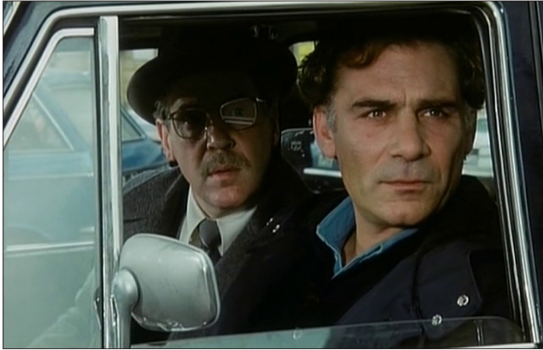
Abb. 4: In IO HO PAURA wird der Protagonist stetig überwacht. Selbst die eigenen Vorgesetzten, eigentlich Vertreter des offiziellen Rechts, sind hier Agenten einer zweiten, klandestinen gesellschaftlichen Ordnung.

regelrecht implantiert wird. Gleichzeitig muss der Brigadiere aber so tun, als würde er die unausgesprochene Gewaltdrohung gar nicht bemerken: Er glaubt zwar nicht mehr an die offizielle symbolische Ordnung, da er von der Existenz der dahinterstehenden und weitaus mächtigeren mafiösen Schattenordnung weiß; diese verlangt jedoch von ihm, genau so zu tun, als wäre die »offizielle« Ordnung noch intakt. In ebendiesem Repräsentationsverbot, das zugleich als stumme Repräsentation einer zweiten, illegalen staatlichen Ordnung fungiert, liegt die paradoxe Struktur der Verschwörung begründet, von der das politische Paranoia-Kino der 1970er-Jahre handelt (vgl. Pause). Das paranoide Subjekt ist hier gerade kein rebellierendes, sondern ein getriebenes, in seinem eigenen, verhängnisvollen Wissen gefangenes, dessen verschwörungstheoretische Rationalität aus einer strukturellen Unfähigkeit zur wahren Rede – eben einer Beschädigung des Symbolischen – resultiert. Sein letzter authentischer (Nicht-)Ausdruck ist seine innere Stimme, die nicht nach außen treten darf – und die Damiani daher als eine Art Anti-Acoustmètre inszeniert, als eine Stimme, die – in Anlehnung an Michel Chions Theorie des Acoustmètre (1994), jener eigentümlich machtvollen Voice-over-Stimme des Kinos, deren Quelle unsichtbar bleibt – gleichzeitig ubiquitär und unhörbar ist.