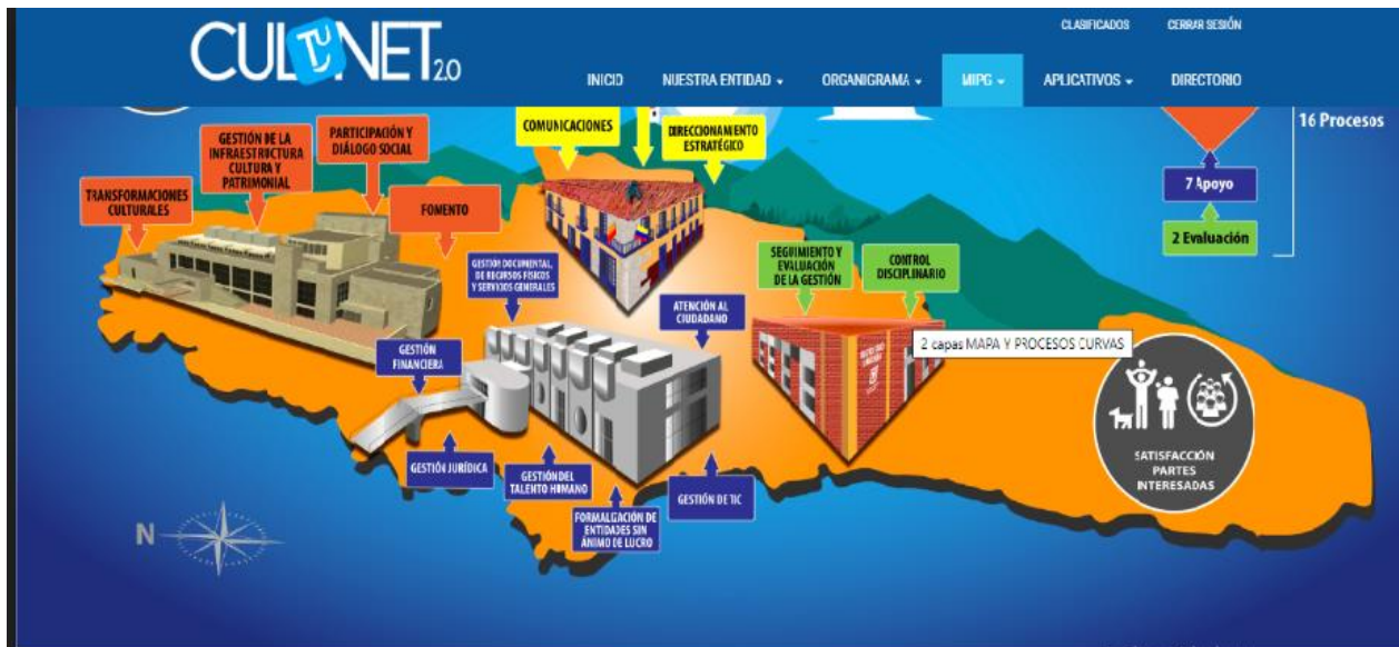
Figura 1. Mapa de procesos de la Secretaría Distrital de Cultura, Recreación y Deporte

Se consultó la página de CULTUNET de la Secretaría de Recreación, Cultura y Deporte, en la se muestra el Mapa de los procesos a partir de la implementación de MIGP