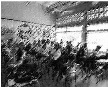
Figura 10. Estudiantes 901