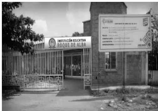
Figura 3. Entrada Institución Educativa Roque de Alba