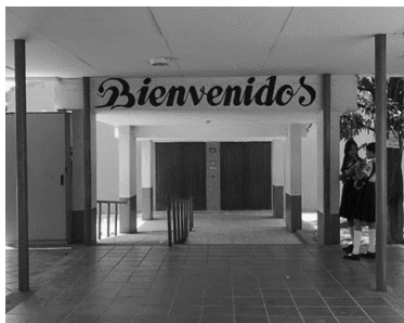
Figura 8. Auditorio