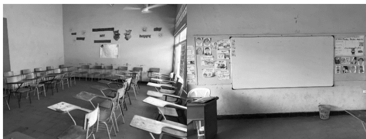
Figura 11. Aula de inglés