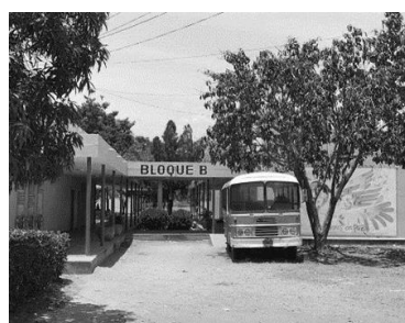
Figura 7. Entrada Bloque B