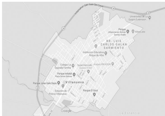
Figura 1. Mapa Villanueva