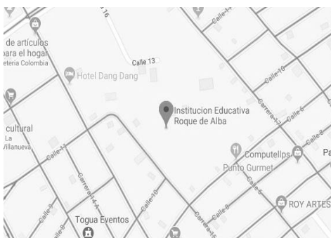
Figura 2. Mapa Institución Educativa Roque de Alba

La Institución Educativa Roque de Alba es un colegio de carácter mixto y oficial, fundada a través de la ley 17 de 1964. Su sede principal está ubicada en la Calle 14 No. 15-90 y en ella funciona la básica secundaria, la media y la jornada sabatina con los ciclos lectivos integrados (CLEI). Los niveles de preescolar y básica primaria se encuentran en la sede Luis Beltrán Dangond ubicada en la carrera 18 N° 15 – 22.