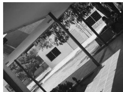
Figura 9. Coordinación