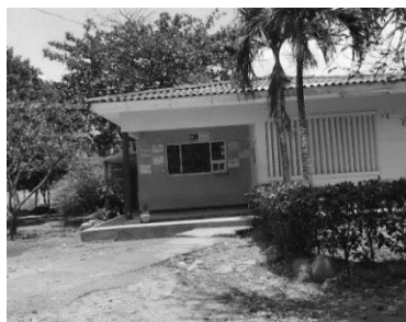
Figura 4. Rectoría