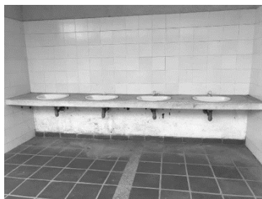
Figura 4. Baños Escolares