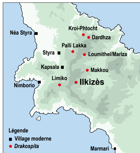
Localisation des drakospita autour de Styra. Karte der Drakospita um Styra.

Karl Reber – Maria Chidioglou – Angeliki Simosi – Chloé Chezeaux – Jérôme André