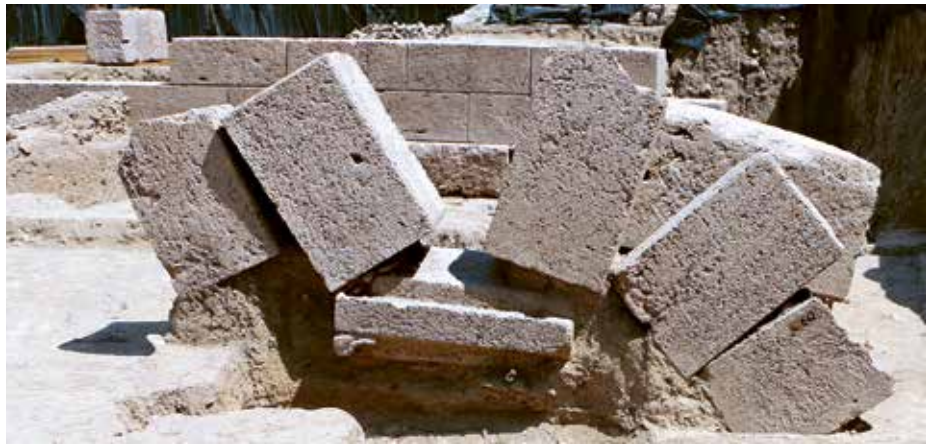
Umgestürzter Pfeiler der Stützmauer gegen den Hang des Hügels — Pilier effondré du mur de soutènement contre la pente de la colline.

Der Stützbau besteht aus zwei rechtwinklig angeordneten Mauern aus ungenauem isodromem Quadermauerwerk. Seine Stabilität wird durch mehrere Pfeiler gewährleistet, die in regelmässigen Abständen gegen die am Hang stehende Mauer gebaut wurden. Jeder zweite setzt sich auf der Aussen-seite fort und dringt tief in den Hügel ein. Die Kampagne 2020 hat wichtiges Material