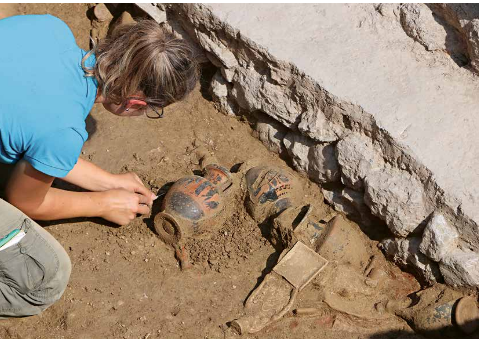
Dépôt d'offrandes en cours de fouille dans le temple (6) — Opferdepot im Tempel (Gebäude 6) während der Ausgrabung.

Sous la fondation massive du mur nord, composée de larges blocs de conglomérat, un sondage en profondeur a révélé l'existence d'un mur antérieur, en pierre sèche et brique crue (M142). La superposition des deux structures suggère l'existence de deux états de construction, une hypothèse qui devra être vérifiée lors de la prochaine campagne de fouille.