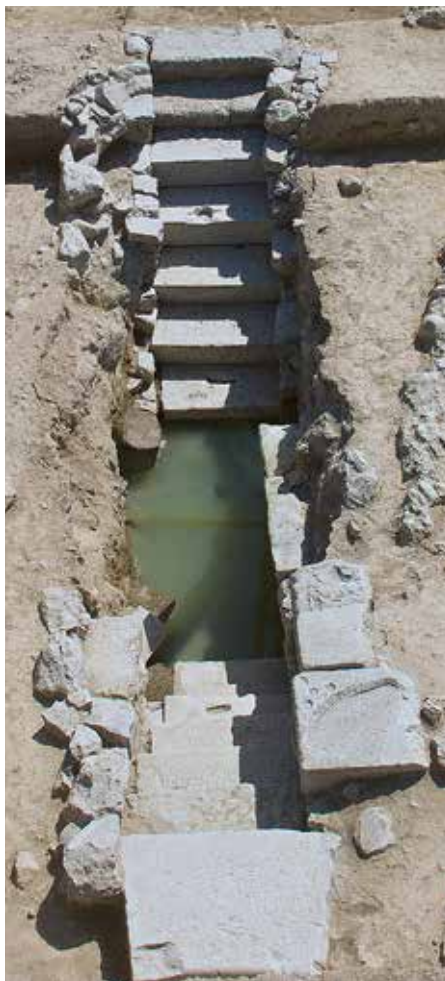
Römischer Brunnen — Puits d'époque romaine.

Im 2. Jh. scheint das Heiligtum nach Osten erweitert worden zu sein. Hinter der grossen Osthalle (1) entstand eine Platzanlage, die mit einer in isodomem Mauerwerk errichteten Steinmauer (4) umgeben war. Die durch Stützpfiler befestigte Rückmauer diente auch dazu, ein Abrutschen des Hanges des dahinter liegenden Hügels zu verhindern. Diese Platzanlage war durch eine in die Rückwand der Osthalle eingelassene Tür mit vorgelagertem Propylon zu betreten. Was sich auf diesem Platz abgespielt hatte, ist bisher noch nicht bekannt.