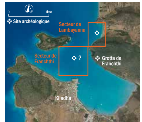
Baie de Kiladha (Argolide). Bucht von Kiladha (Argolis).

Ce double échec est difficile à justifier : en deux endroits de la baie, les plongeurs n'ont pu que constater la régularité du fond marin là où l'échosondeur multifaisceaux annonçait un relief accidenté. Se pourrait-il que la géolocalisation soit inexacte, et que ravines et dépressions se trouvent ailleurs ? Cela paraît peu probable en l'occurrence.