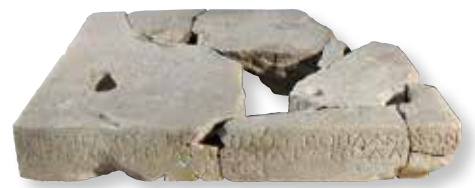
Base de statue érigée par Tèchippos pour son frère Apellès — Sockel einer von Techippos für seinen Bruder Apelles aufgestellten Statue.