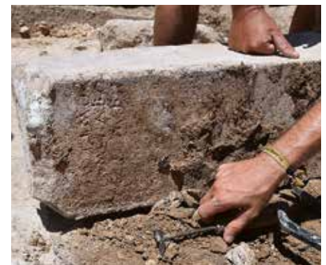
Dédicace à Hermès découverte en 2019. Weihung an Hermes bei ihrer Entdeckung 2019.

très insuffisamment connu. C'est d'ailleurs dans ce domaine que, du point de vue épigraphique, les campagnes à venir semblent pouvoir rester également fructueuses. Car si les chances de découvrir un second « conservatoire d'inscriptions » sont sans doute assez faibles, il est en revanche tout à fait raisonnable de penser que l'extension de la fouille mettra au jour d'autres témoignages sur les cultes pratiqués dans le sanctuaire : n'est-ce pas déjà le cas de cette dédicace assez inattendue à Hermès, trouvée l'an dernier en remploi près de l'édifice 6, c'est-à-dire, on le sait maintenant, dans le périmètre du temple archaïque de la déesse ?