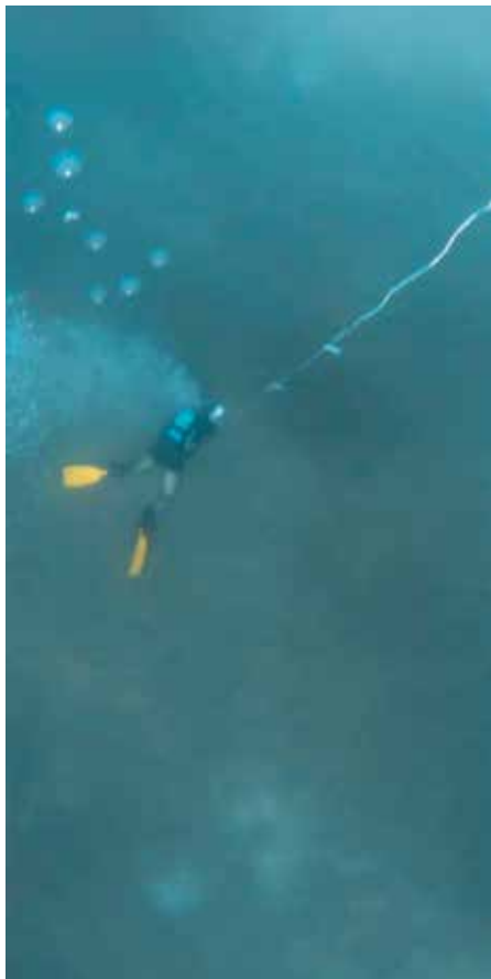
Exploration sous-marine sur des éléments du paysage préhistorique – Erforschung der versunkenen prähistorischen Landschaft.