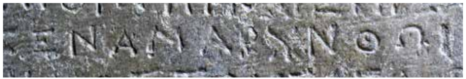
Ehrendekret mit der Erwähnung von Amarynthos — Décret honorifique avec la mention d'Amarynthos.

letzten Zweifel beseitigen: deutlich waren darauf die Worte Ἀρτέμιδος ἐν Ἀμαρύνθῳ zu lesen (Artemis in Amarynthos). In einem weiteren Dokument, das ebenfalls in der Brunnenanlage verbaut war, wurde die Eingliederung der südeuböischen Stadt Styra in das Territorium von Eretria vertraglich geregelt. Bereits der Geograph Strabo (X,1,10-12), der das wichtigste schriftliche Zeugnis zum Heiligtum geliefert hat, erwähnt in seinem Text die dortige Aufstellung von bedeutungsvollen Inschriften. Das Heiligtum der Artemis Amarysia diente somit nicht nur der öffentlichen Ehrung verdienter Bürger von Eretria – von der die zahlreichen Statuensockel zeugen – sondern auch als Aufstellungsort wichtiger Verträge der Stadt Eretria mit den Nachbarstädten, die damit unter den Schutz der