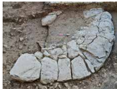
Foyer au centre de l'édifice 6 — Feuerstelle im Zentrum des Gebäudes 6.

S. Verdan - T. Theurillat - T. Krapf - D. Greger - K. Reber, The Early Phases in the Artemision at Amarnthos in Euboea, Greece , in: T. E. Cinquantaquattro - M. D'Acunro (éds), Euboica II, Pithekoussai and Euboea between East and West , AION n.s. 27 (Naples 2021)