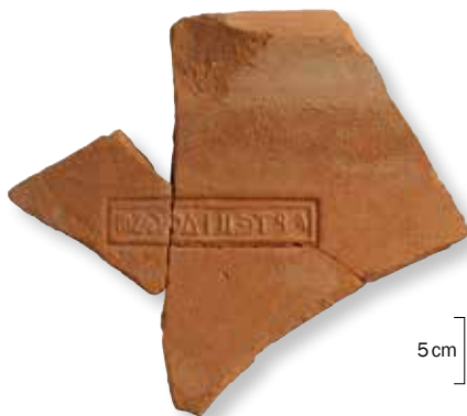
Tuile estampillée au nom d’Artémis. Mit dem Namen der Artemis gestempelter Ziegel.

Durant la première décennie de sondages et de fouilles au pied de la colline de Paleokklisies (2006-2007, puis 2012-2016), l’épigraphie — qui avait joué un grand rôle pour la localisation approximative du sanctuaire — n’a occupé qu’une place modeste dans l’inventaire des trouvailles : en effet, seul un très petit nombre d’objets inscrits fut alors découvert, mais ces fragments, chacun à leur façon, laissaient déjà soupçonner le caractère à la fois public et sacré des vestiges mis au jour.