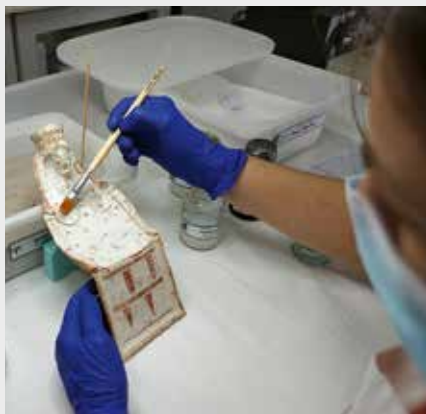
Figurine féminine en terre cuite de type «pappas» en cours de restauration. De tels objets votifs sont rarement découverts en contexte de fouille. Weibliches Brettidol (Typ «Pappas») während der Restauration. Solche Votivobjekte werden nur selten in Grabungskontext entdeckt.