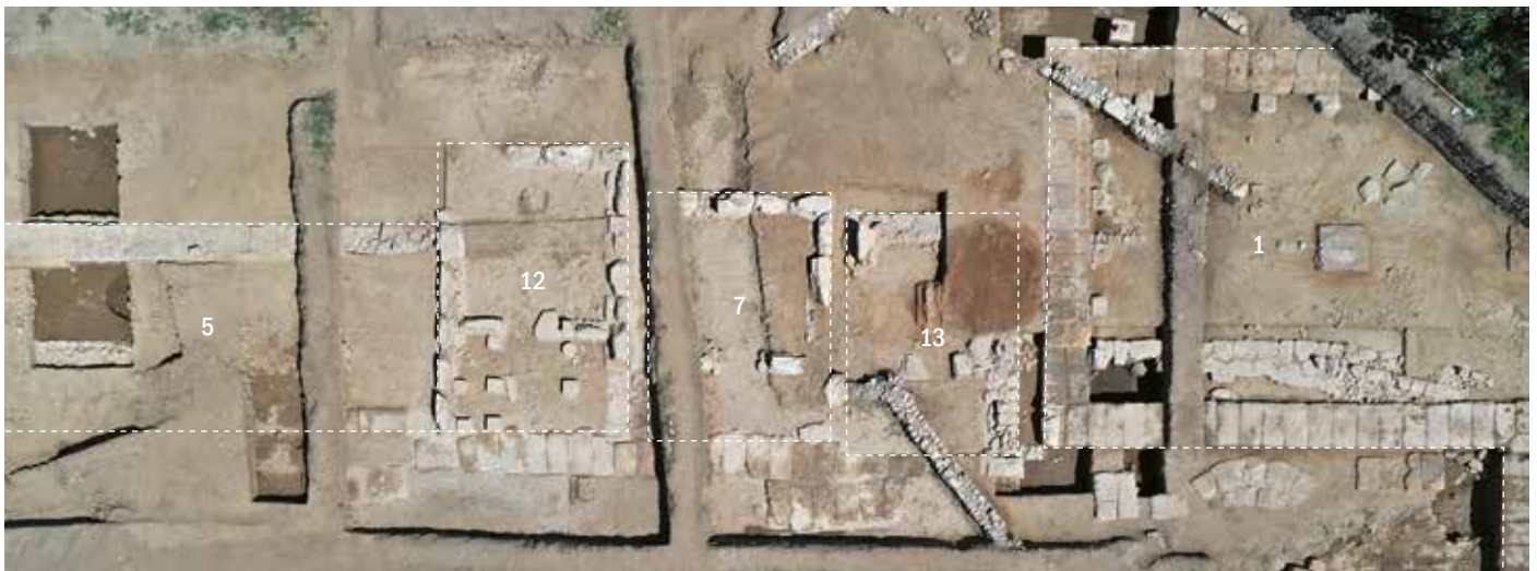
Die Bauten am nördlichen Rand des Heiligtums – Les bâtiments bordant le sanctuaire au nord.