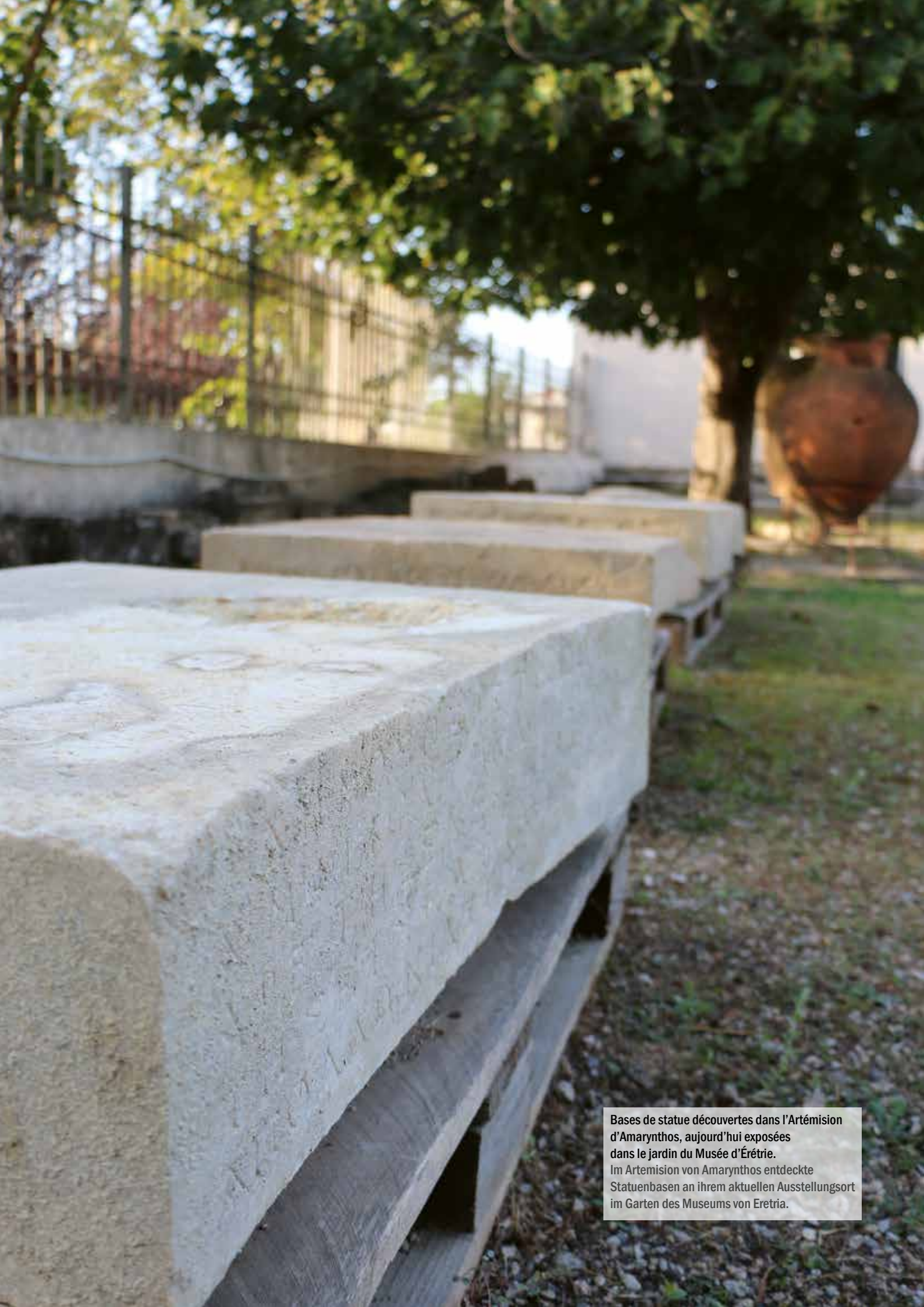
Bases de statue découvertes dans l'Artémision d'Amarnthos, aujourd'hui exposées dans le jardin du Musée d'Érétrie. Im Artemision von Amarnthos entdeckte Statuenbasen an ihrem aktuellen Ausstellungsort im Garten des Museums von Eretria.