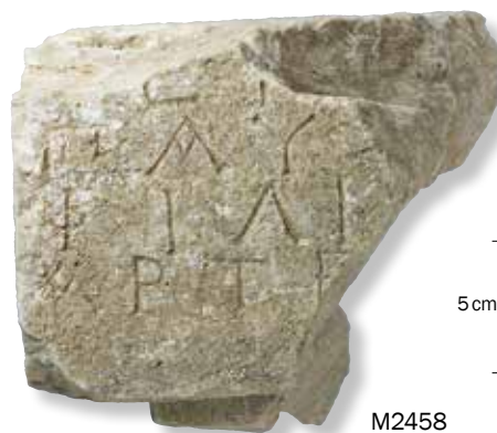
Fragment de piédestal pour une statue en bronze. Bruchstück eines Sockels für eine Bronzestatue.

démontage, l’année suivante, d’une partie de la structure à cause des risques d’effondrement et en vue de l’anastylose de tout le monument a fait apparaître une dizaine de nouveaux piédestaux, les uns inscrits, les autres anépigraphes (mais appartenant néanmoins, pour la plupart d’entre eux, à des monuments dont l’inscription avait dû être gravée sur la partie médiane du socle, comme c’est le cas de la base portant la célèbre statue de l’Éphèbe d’Érétrie au Musée National d’Athènes) ; lors de la campagne de 2020, enfin, trois fragments supplémentaires ont été mis au jour dans le secteur central du chantier, confirmant que ces monuments avaient grandement souffert dès l’Antiquité. Le plus important d’entre eux (M2458) — où se lisent encore des éléments de la nomenclature de trois personnages et surtout le nom de la déesse — est la partie gauche d’un bloc qui se raccorde à l’arrière (par l’intermédiaire d’un fragment non inscrit) à un piédestal mutilé provenant du puits (M2405). Plusieurs de ces socles en morceaux devront faire l’objet d’un travail de recollage par les soins de nos restaurateurs avant de pouvoir être dessinés et publiés de façon adéquate.