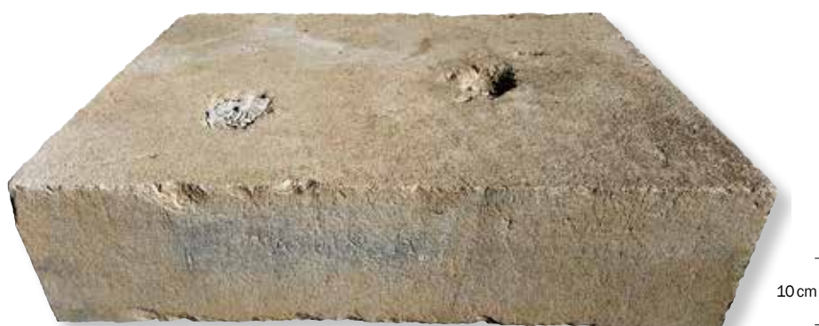
Base de statue pour la nymphe Archô — Basis einer Bronzestatue für die Nympe Archo.

Während die epigraphischen Funde der Ausgrabung in Amarynthos bis 2016 sehr spärlich und stark fragmentiert waren, gelang während den letzten vier Kampagnen die Entdeckung zahlreicher wichtiger Dokumente. Besonders hervorzuheben sind die mit dem Namen der Artemis gestempelten Ziegel und die Statuenbasen mit Weihung an die Triade von Artemis, Apollon und Leto, die zur Identifizierung des Heiligtums geführt haben. Wiederverwendet im römischen Brunnen sind aber auch zwei längere Dokumente erhalten geblieben: der Sympoliteia-Vertrag zwischen Eretria und Styra, der älteste Text seiner Art, sowie eine Ehrendekret für fünf Militärbeamten. Von speziellem Interesse ist auch die Statuenbasis für die bisher unbekannt Nympe Archo, die einen neuen Beitrag zur Rekonstruktion der wenig bekannten lokalen Mythologie liefert.