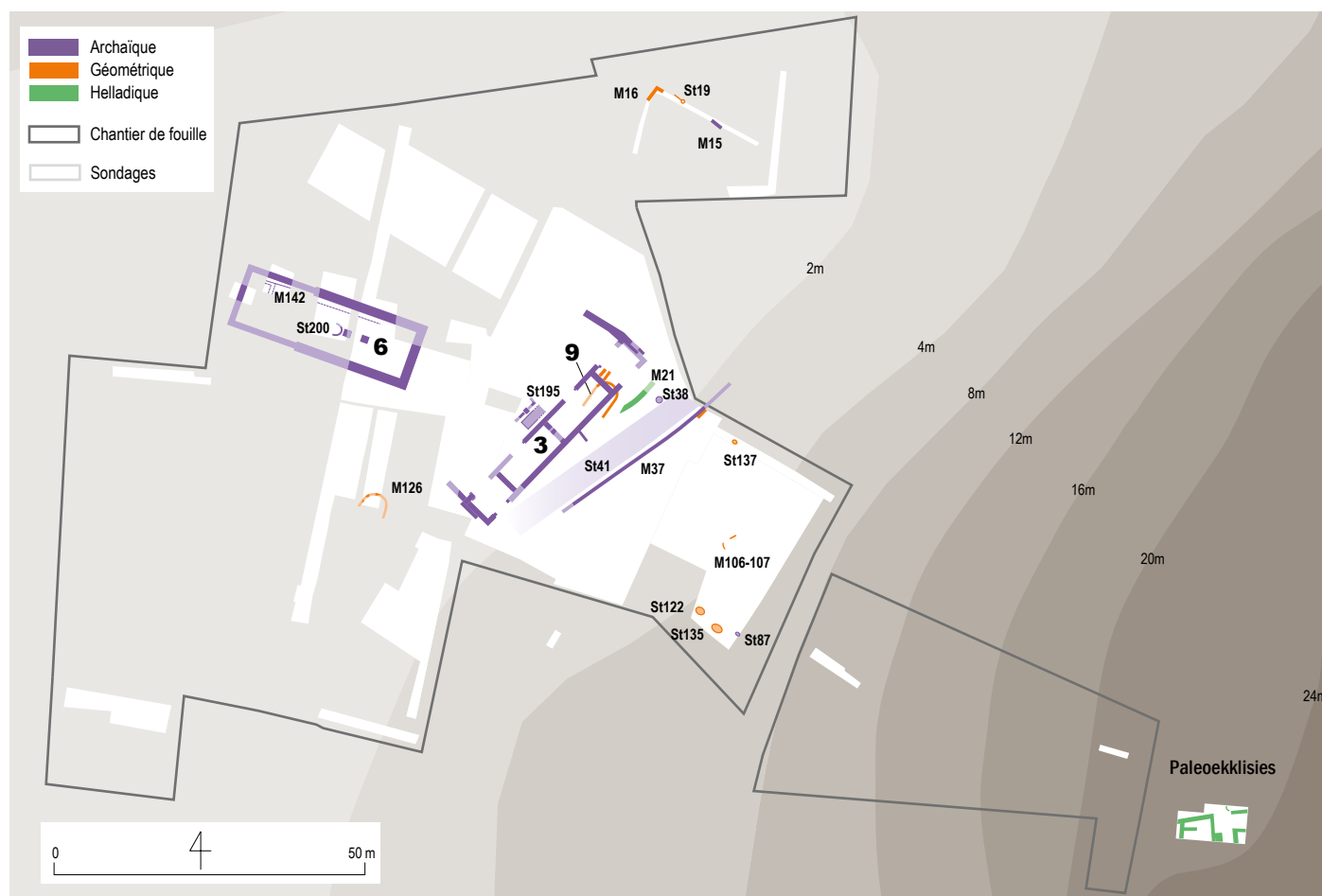
Plan des phases préclassiques dans l'Artémision — Plan der präklassischen Phasen des Artemisions.

C'est donc avec la période archaïque que les traces d'activités culturelles se multiplient et que les contours du sanctuaire commencent à se dessiner à nos yeux.