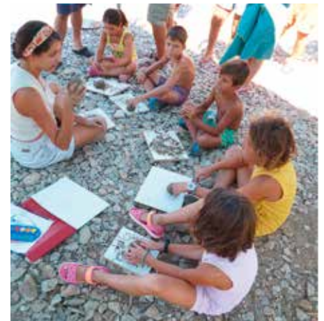
Atelier de céramique pour enfants. Keramikworkshop mit Kindern.

Comme chaque été depuis 2015, les travaux sur le terrain ont été suivis d'une formation en archéologie expérimentale : il s'agit pour les participants de comprendre comment on faisait de la céramique au Néolithique, en s'inspirant des vases découverts dans la grotte de Franchthi et aux environs. Durant une semaine, diverses activités ont ainsi été proposées, dont la collecte d'argile dans une zone marécageuse à l'extrémité sud de la baie, la fabrication de vases et leur cuisson dans des fosses creusées à cet effet sur la plage de Lambayanna. Cette dernière étape a fait l'objet d'une rencontre avec le public, invité pour l'occasion. Les enfants pouvaient en outre participer à un atelier de céramique organisé tout spécialement pour eux.