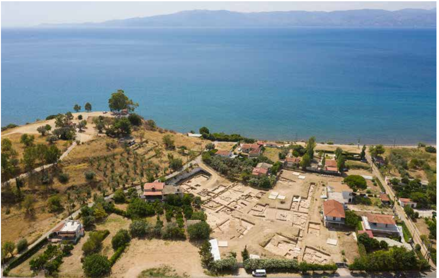
Das Heiligtum der Artemis Amarysia am Fuss des Paläoekklisies-Hügels – Le sanctuaire d'Artémis Amarysia au pied de la colline de Paleoeekklisies.

Die Grabungen fanden in enger Zusammenarbeit mit der Ephorie für Altertümer Euböas statt. Dank Bohrungen und geophysikalischer Messungen, die vom CNRS (CEREGE) und der Universität Thessaloniki durchgeführt wurden, konnten die verschiedenen Sondierschnitte präzise angelegt werden. Nach und nach ergab sich so ein immer reicheres Bild von der Anlage des Heiligtums.