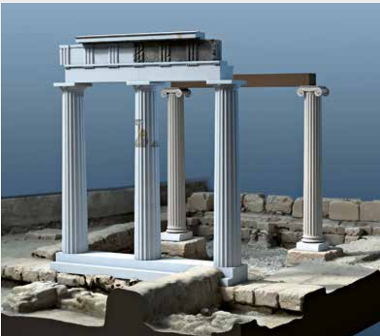
Teilrekonstruktion der Oststoa mit Angabe der erhaltenen Bauteile. Reconstruction partielle du portique oriental sur la base des vestiges conservés.

Von der Oststoa sind neben den gut erhaltenen Fundamenten einige wenige, aber aufschlussreiche Architekturelemente erhalten. Im Rahmen einer Masterarbeit an der Zürcher Hochschule der Künste wurden die entsprechenden Funde von Oliver Bruderer über 3D-Fotogrammetrie digitalisiert und anschliessend mithilfe der fachlichen Expertise von Alexandra Tanner (Bauforscherin, Universität Zürich) in einem virtuellen Modell rekonstruiert (siehe auch das Titelbild). Die digitale 3D-Modellierung erlaubte neue Möglichkeiten für die Auseinandersetzung mit den Befunden. Weitere Infos: diplome.kvis.zhdk.ch/Oliver-Bruderer