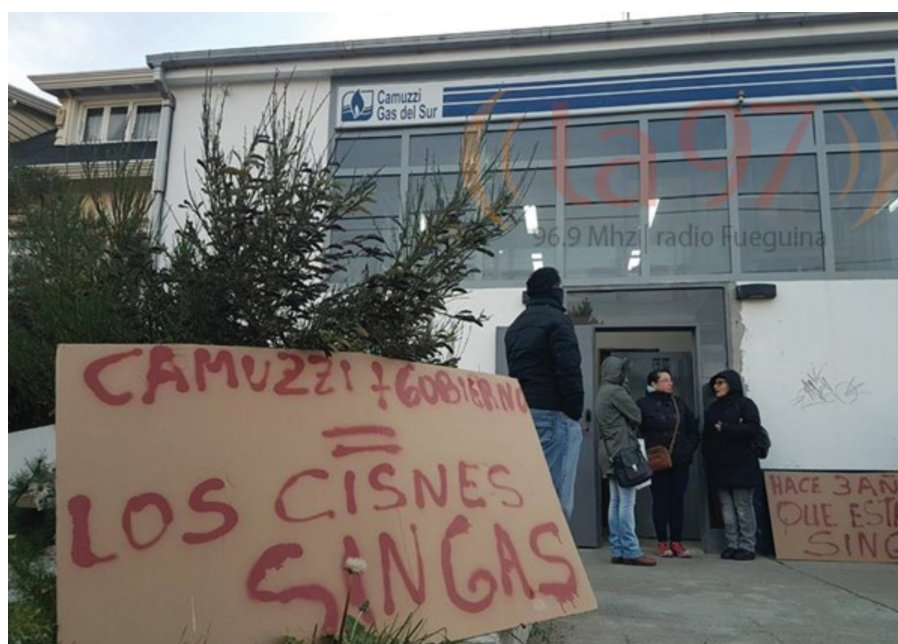
Figura 2. Protesta de vecinos del barrio Los Cisnes frente a Camuzzi Gas del Sur, oficina Río Grande, Tierra del Fuego.

El colectivo de vecinos priorizó la utilización de medios de comunicación, tanto radiales como gráficos y televisivos, para visibilizar ciertas acciones. Es decir que construyeron una estrategia para posicionar en la agenda pública sus demandas. Expresado en términos de los entrevistados: "[Y si llaman a una actividad, no sé, hay que ir a reclamar por tal cosa, al gas, al transporte, a lo que sea] Hacemos una nota como corresponde. [¿Y cuándo es que llaman así al canal de televisión?] Cuando las papas queman" (entrevistado