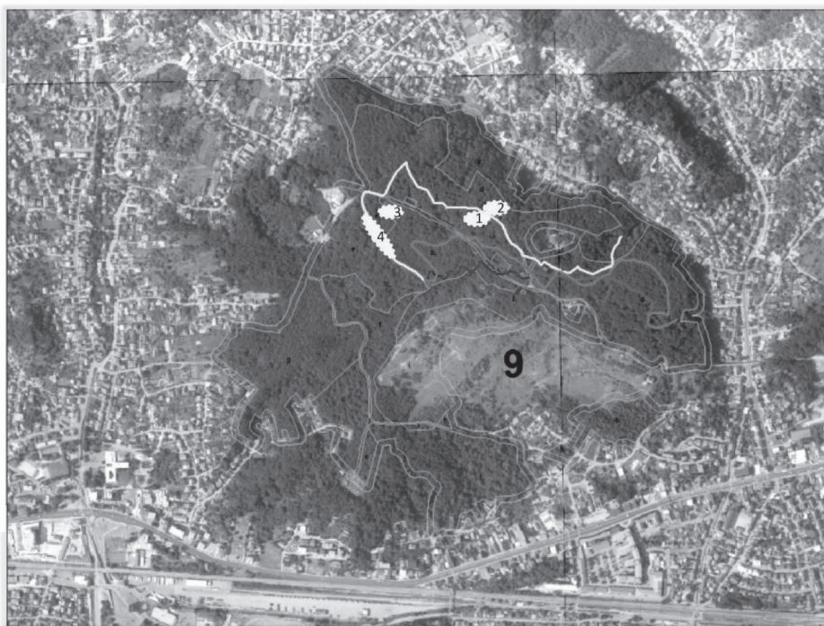
Slika 2. Prikaz planiranih sadržaja park-šume Grmošćica Fig. 2 Overview of the planned facilities in Grmošćica Forest Park