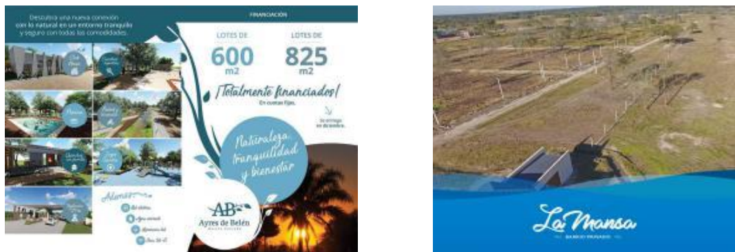
Figura N° 4. Propagandas de barrios cerrados en el AMGR