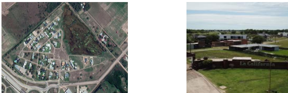
Figura N° 3. Barrios cerrados: “La California” (Resistencia)