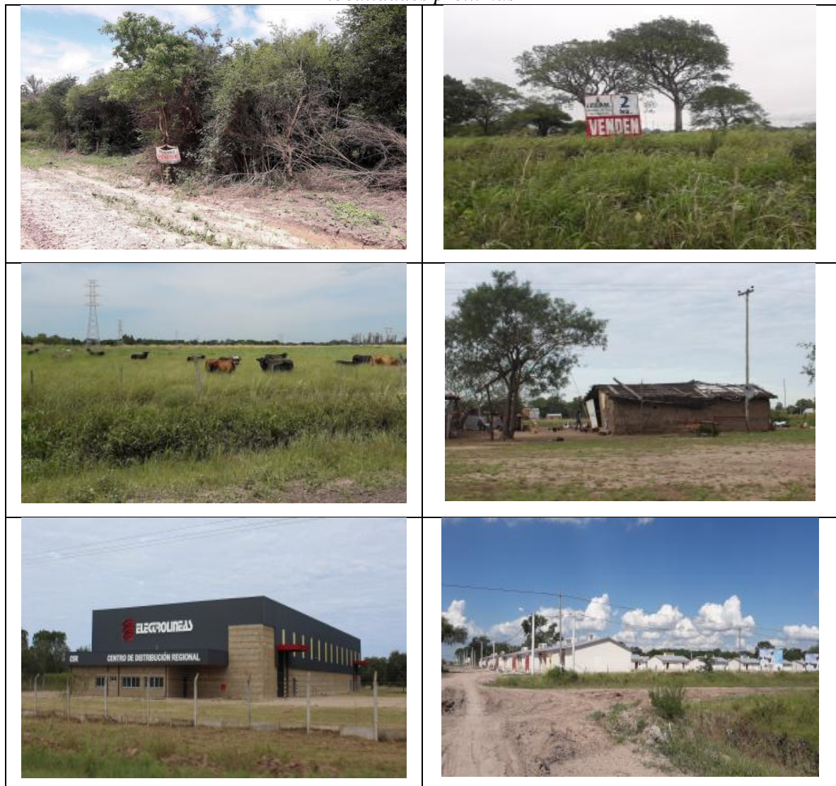
Figura 1. Paisajes resultantes en el periurbano del AMGR y los espacios de transición con localidades próximas