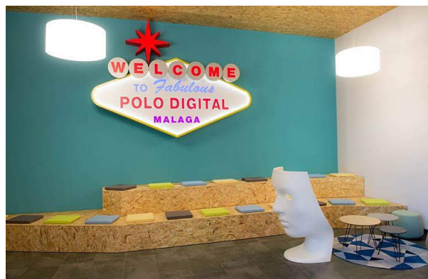
Imagen 3. Polo de Contenidos Digitales