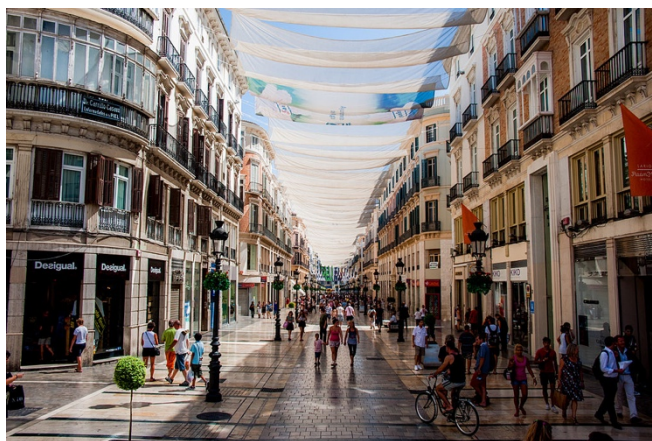
Imagen 1. Calle Marqués de Larios