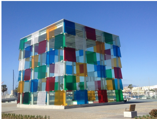
Imagen 2. Museo Pompidou

Además de la oferta museística de la ciudad, Málaga asocia su nombre al cine español desde 1998, fecha de la primera edición del Festival de Cine Español de Málaga, certamen de cine español con un mayor prestigio, y eventos más recientes como la celebración en la ciudad de los Premios Goya 2020, algo que también ocurrirá en el próximo año, y los Premios Max de Artes Escénicas también en 2020. Esta relación con el cine y la producción audiovisual se ha visto reforzada por el creciente número de producciones nacionales e internacionales que utilizan la ciudad como localización, como muestran los 56 largometrajes, 39 documentales, 15 series, 19 programas de televisión, 31 videoclips y 47 spots publicitarios rodados en la ciudad en los últimos años, con un crecimiento de la inversión del 79% en 2019 respecto al año anterior (Málaga Film Office, 2020).