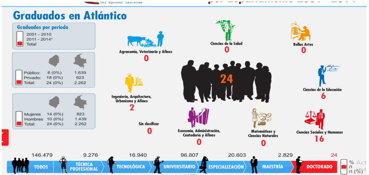
Figura 3. Graduados por áreas del conocimiento en el nivel de doctorado en el Departamento del Atlántico (2014).