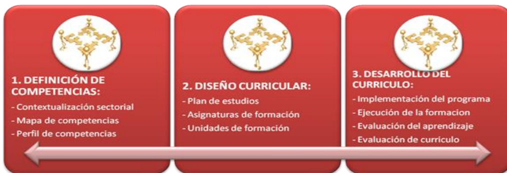
Figura No 4 Modelo de Competencias de la Universidad de la Costa - CUC.

En la Figura 4 se puede observar el Modelo de Competencias de la Universidad de la Costa – CUC.