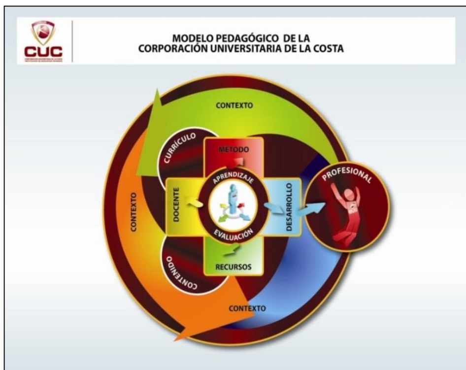
Figura No 4. Modelo Pedagógico de la Corporación Universidad de la Costa – CUC

Los anteriores conceptos sintetizados bajo la óptica de un enfoque pedagógico denominado desarrollista, pretenden darle identidad a la Institución y al programa, mas no unificar las estructuras conceptuales de los administradores, directivos, docentes y estudiantes. El talento humano de la institución debe ser consciente de la dinámica de la academia, de la ciencia y de los enfoques y teorías filosóficas, científicas y pedagógicas; por lo tanto, el modelo aquí expuesto es un norte para el quehacer docente institucional, no una camisa de fuerza. Pero si es un conjunto de criterios que le dan vida y justificación a las acciones de la Universidad para que se vivencien con calidad y pertinencia los principios, criterios y lineamientos enunciados. La Figura 4 representa la síntesis del modelo pedagógico institucional y en la Tabla 3.4 se aprecian las concepciones básicas para la comprensión del modelo.