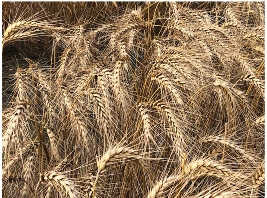
Figur 1. Vete med främmande kromosomfragment från fältförsök år 2020.

Proteinkvalitet och bakningskvalitet är nära kopplade egenskaper hos vete. Proteinkvaliteten bestämmer både hur starkt glutenet är och hur hög proteinkoncentrationen är i mjölet. Styrkan i glutenet bestämmer vad det kan användas till; fransbröd behöver ett starkt gluten för att brödet ska få den rätta fluffigheten. Bakning av bröd kräver relativt stora mängder vete för att analyserna ska kunna göras och analyserna är inte standardiserade mellan olika laboratorier världen över. Analyser av proteinkvalitet är mycket mindre komplicerade, kräver mindre mängd material, går fortare och är billigare att utföra än vad bakningskvalitetsanalyser är. Där-