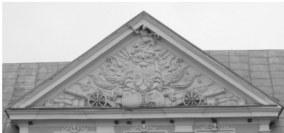
1. Wiśniowiec, północna elewacja pałacu – tympanon, stan z 2016 r.

fiki i malowidła 38 oraz rzeźby 39 . Efekty prac przeprowadzanych po przejęciu obiektu przez Mniszchów obrazują dokumenty z przełomu lat pięćdziesiątych i sześćdziesiątych XVIII stulecia, wśród nich inwentarz spisany post mortem Jana Karola 40 . Dla badań nad programem funkcjonalnym wnętrza szczególnie ważny jest wykaz z lat 1758-1764, przechowywany w Narodowej Bibliotece Ukrainy w Kijowie 41 . Bezenną podstawę stanowią wreszcie źródła ikonograficzne, w tym rzuty poszczególnych kondygnacji 42 . Mimo trudnych losów i zniszczeń obiektu poszczególne motywy są możliwe do obserwacji in situ (np. tympanon) bądź zostały udokumentowane na zdjęciach z pierwszych dekad XX stulecia (niezachowane wnętrza) 43 . Motywy heraldyczne identyfikujące poprzednich właścicieli występowały w dekoracji architektonicznej pałacu. Zachowane rachunki potwierdzają, że zdobienia zostały wykonane przez sztukatora o imieniu Piotr w 1732 roku 44 . Herby Wiśniowieckich