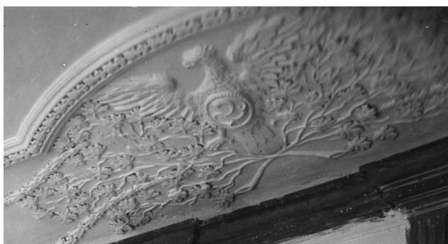
3. Wiśniowiec, pałac – dekoracja stropowa (detal), stan z 1928 r.

i Radziwiłłów w otoczeniu panopliów stały się częścią dekoracji umieszczonej na tympanonie nad głównym wejściem do siedziby (il. 1).