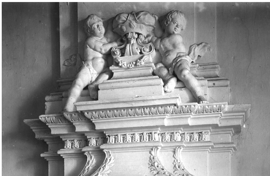
4. Wiśniowiec, pałac – zwieńczenie kominka, stan z 1928 r.

poprzednich właścicieli nawiązywano również za sprawą mobiliów. Analiza przekazów piśmiennych i ikonograficznych poświadcza, że funkcje reprezentacyjne pełniły przede wszystkim sale znajdujące się w głównym korpusie pałacu. Skrzydła boczne mieściły sekwencje apartamentów oraz przestrzeni użytkowych, do których należały apteczka, kuchenka, czy skarbiec. Szczegółowa analiza programu ideowego pałacowych wnętrz wykracza poza cel niniejszej, krótkiej analizy. Warto jednak przywołać kilka przykładów pomieszczeń, w których szczególnie mocno zaakcentowano prestiż poprzednich właścicieli.