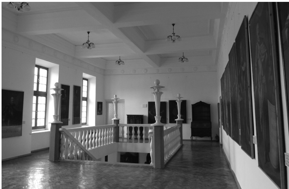
5. Wiśniowiec, wnętrze pałacu – stan z 2016 r.

Janusza (1599-1636) i Konstantego Krzysztofa (1636-1686) 50 . Ostatni z wymienionych magnatów był mężem Urszuli Mniszchówny, a po zawarciu kolejnego związku z Anną z Chodorowskich został ojcem omawianego hetmana Michała Serwacego 51 . Jedną z kluczowych postaci zacieśniających relacje między Wiśniowieckimi i Mniszchami był Konstanty Krzysztof. Uwieczniono go na obrazie, który zawieszono nad kominkiem w pokoju boku, pełniącym funkcję sypialni 52 .