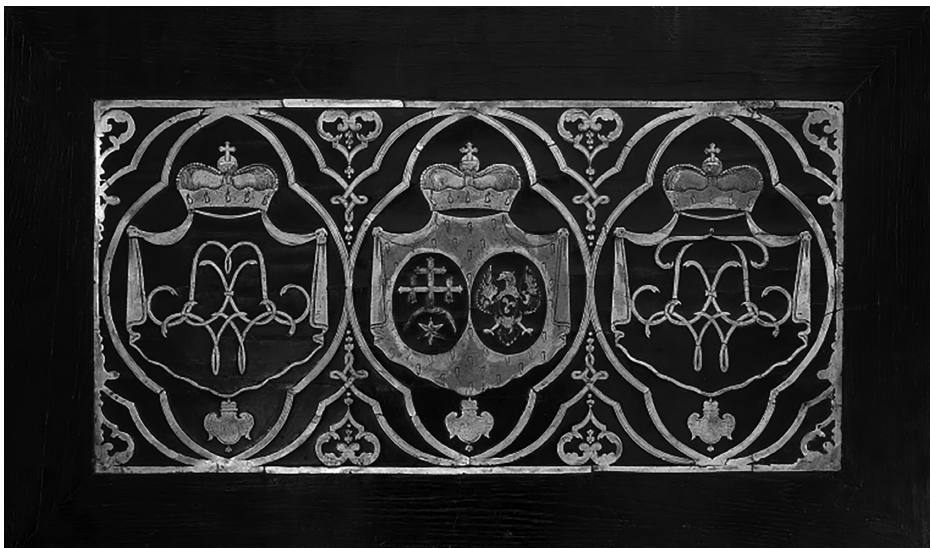
7. Stolik z herbami i monogramami Tekli z Radziwiłłów i Michała Serwacego Wiśniowieckich – blat.

wnuczki Michała Serwacego Wiśniowieckiego 57 . W przyległej sionce stały dwa stoliki, w tym jeden do gry w karty, a ściany zdobiły dzieła z zamku laszeckiego – dwie genealogie Sapiechów i przedstawienie bitwy z wojskiem tureckim – oraz obraz św. Marii Egipcjanki i widok architektury na papierze . Poprzez portret Zofii Tyszkiewiczowej, córki Michała Wiśniowieckiego, ponownie wskazano na poprzednich właścicieli 58 . W pokoju panińskim , gdzie odnotowano żółte obicie z plisi, zielone zasłony, stoły i szafę z Laszek Murowanych, prezentowano dwa portrety Wiśniowieckich 59 . W skarbcu składowano pamiątki po poprzednich właścicielach obiektu. Rodowy symbol Wiśniowieckich widoczny był między innymi na aksamitnych kaletach ze srebrno-złotymi