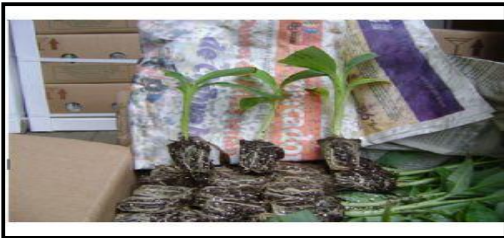
Anexo No.1 Plántulas con sustrato propicio para ser establecidas en campo.