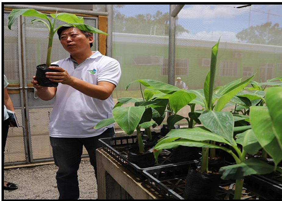
Ilustración 2 Plántulas de 16 semanas