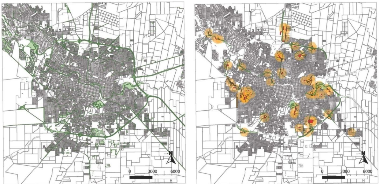
Gráfico 2: Izquierda: Áreas verdes a . Derecha: Sumatoria de problemáticas anteriormente descriptas b .

b Elaboración propia en base a mapa realizado por el Observatorio Urbano de la UNC, 2011.