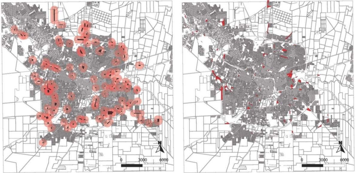
Gráfico 1: Izquierda: Basurales a cielo abierto con un radio de influencia de 500m a . Derecha: Villas relevadas por Un Techo Para Mi País b .

a Elaboración propia en base a mapa realizado por el Observatorio Urbano de la UNC, 2009.