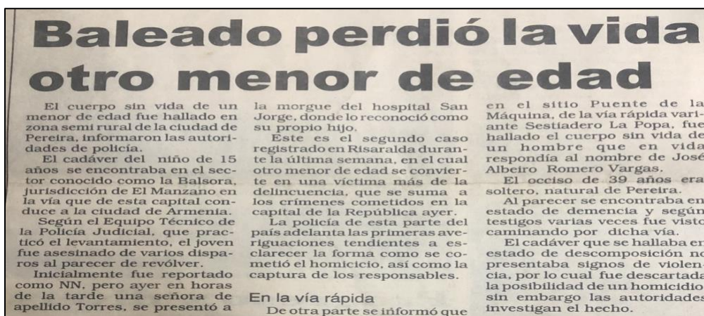
Figura 2. Reseña periodifica asesinato de menor

Nota: Diario del Otún 6 de octubre de 1994.