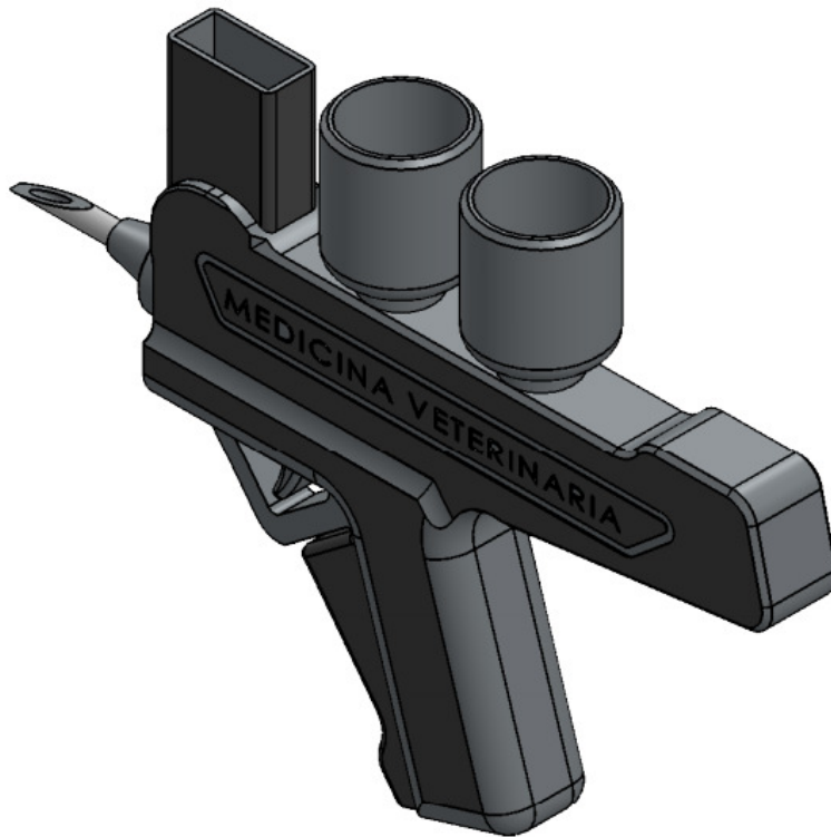
Gráfico 4. Diseño en 3D de la parte superior del inyector autorrecargable.

Como se puede ver en los gráficos 3 y 4, existe en la parte superior del inyector un dispositivo que permite almacenar las agujas que se van a utilizar.