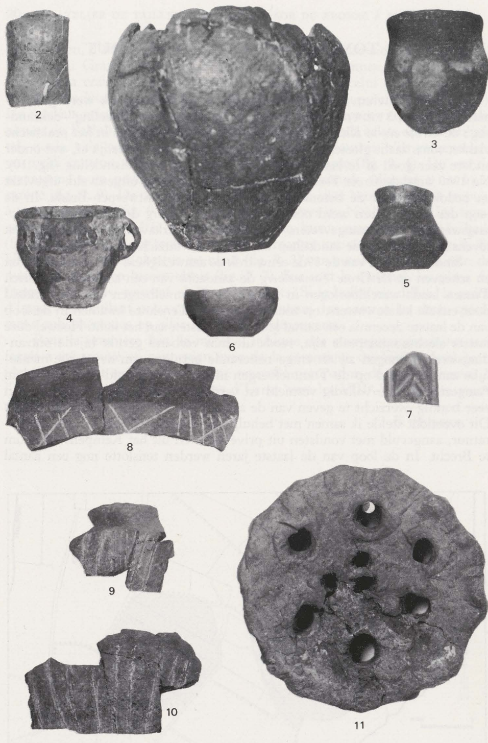
Fig. 11. — Loenhout-Grote Tommelberg: selektie uit de archieffoto's (versch. sch.).