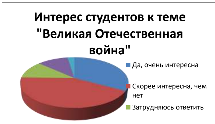
Рис. 1. Интерес студентов к теме «Великая Отечественная война» (в % от числа опрошенных)

У студентов есть интерес к теме Великой Отечественной войны (см. рис. 1), так ответили 75,5% опрошенных (из них 32,9% – очень интересна и 42,6% – скорее интересна).