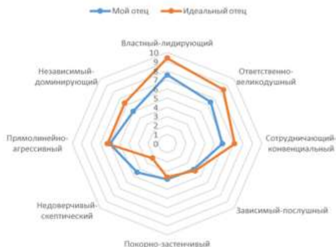
Рис.3. Анализ сравнения межличностных ориентаций по результатам ответов теста Т. Лири «Мой отец» и «Идеальный отец»

отражают лидерские характеристики, стремление к доминированию, наставлению, независимости, способность брать на себя ответственность, требовательность, прямолинейность, строгость, с другой, альтруистические и конформистские характеристики (отражает деликатность, стремление заботиться о близких, умение прощать, заботу, умение подбодрить и успокоить, отзывчивость к призывам о помощи, общительность, доброжелательность, энтузиазм). Наименее выраженные особенности прослеживаются по шкалам «покорно-застенчивый» и «зависимо-послушный». Интерпретируем это как неприемлемость, отрицание в образе отцов подчиняемых и зависимых черт, склонности к слабости, самоуничтожению, пассивности, неуверенности в себе, тревожности, зависимости от других.