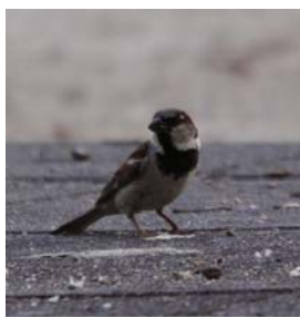
Figura 1. Macho adulto de Gorrión común ( Passer domesticus ) (C) J. A. Peris Lozano.

Dorso y escapulares de color castaño oscuro con estrías negras muy marcadas. La espalda y el obispillo de color gris oscuro con un tinte oliváceo que predomina en las supracobertoras caudales. El pecho adquiere un color blanco con un tinte ligeramente grisáceo que se hace más patente en los flancos y los muslos. Color blanco de tinte grisáceo en el vientre y la región anal. La cola la forman plumas de color pardo grisáceo. En el ala, las primarias se vuelven de un color gris oscuro; las puntas de las terciarias y de las coberteras primarias adquieren un color gris claro, mientras que las puntas de las coberteras medias se tornan de color blanco puro, formando una estrecha banda blanca con el ala plegada (Figura 1).