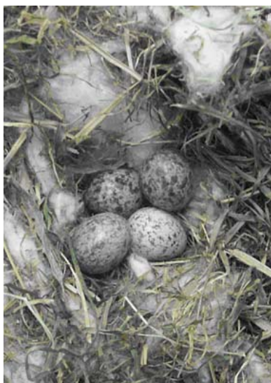
Figura 1. Nido y puesta de Gorrión común.

Paradójicamente, pese a su plasticidad a la hora de ubicar el nido, es un ave que se adapta mal a la cría en cautividad, probablemente debido a su carácter colonial, y son infrecuentes los casos de cría exitosa, uno de ellos en Granada (Moreno-Rueda y Soler, 2002).