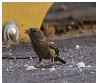
Figura 2. Hembra adulta de Gorrión Común ( Passer domesticus ) (C) J. A. Peris Lozano.

En plumaje nupcial, el píleo, frente, nuca, espalda y cobertoras caudales adquieren un color marrón grisáceo apagado. La ceja se hace más pálida, pero también más estrecha y corta. Auriculares de color gris oliváceo que viran a un gris sucio en la brida y las mejillas. El mentón y la garganta de un color gris oliváceo, pudiéndose formar un pequeño babero de color gris oscuro. Las partes inferiores del cuerpo son de un marrón grisáceo sucio que se aclara en el vientre. El plumaje de las alas presenta un color similar al de la época no reproductora, o tonos ligeramente más pálidos (Figura 2).