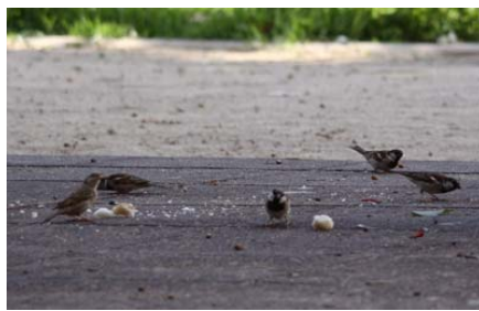
Figura 1. Grupo de gorriónes comunes alimentándose.