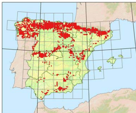
Figura 1. Distribución del mirlo acuático en España. Según López-Alcázar et al.(2003).

En España se distribuye principalmente por el norte de la península (Figura 1), debido a la mayor presencia de ríos adecuados para la especie. En el centro y el sur peninsular está restringida a los sistemas montañosos (López Alcázar et al., 2003), aunque también hay una cita de reproducción cerca del nivel del mar en el campo de Gibraltar (Cádiz) (Allen, 1972). En Sierra Nevada se ha detectado su presencia a 2.400 m de altitud, lo que supone probablemente la mayor altitud que alcance en Europa (Pleguezuelos, 1992).