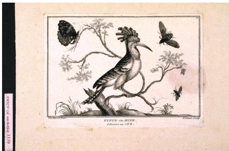
Lámina 3359: Abubilla, dibujo de Jan Van Kessel, grabado de Filloeu

La Unidad de Recursos de Información Científica para la Investigación (URICI) en colaboración con el Archivo del MNCN-CSIC ha hecho un gran esfuerzo por la migración de bases de datos en Access al Catálogo informatizado, pero son aún muchas las láminas de las que no están totalmente identificados los autores, tarea que se irá completando desde el Archivo del Museo. Archivo que, por otra parte custodia otras colecciones muy importantes, que están siendo informatizadas en el Catálogo de Archivos del CSIC . Desde aquí deseo animar a los lectores a darse una vuelta por la Exposición [1] y contemplar láminas y ejemplares del siglo XVIII que sirvieron para la enseñanza de la Historia Natural.