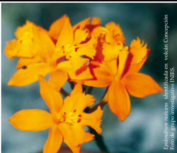
Epidendrum radicans identificada en volcán Concepción Foto de grupo investigativo INIES.