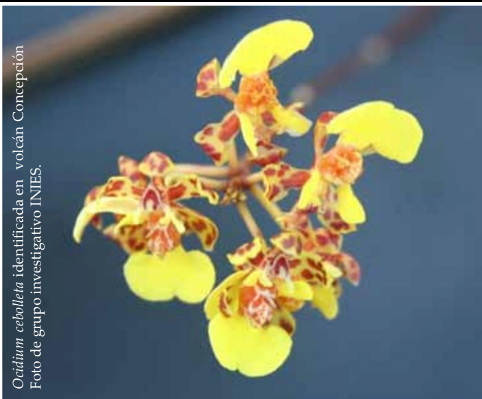
Octitum cebolleta identificada en volcán Concepción