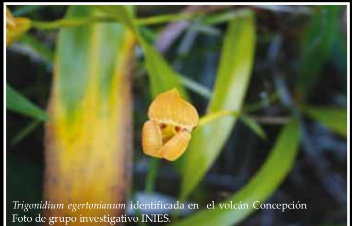
Trigonidium egertonianum identificada en el volcán Concepción