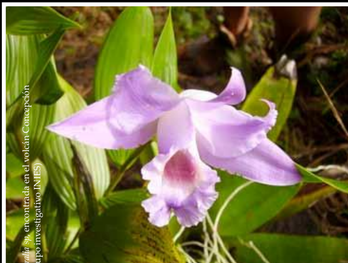
Sorralia sp. encontrada en el volcán Concepción (Cupo Investigativo INIES)