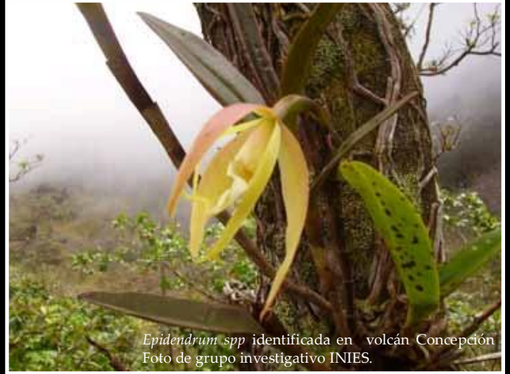
Epidendrum spp. identificada en volcán Concepción Foto de grupo investigativo INIES.