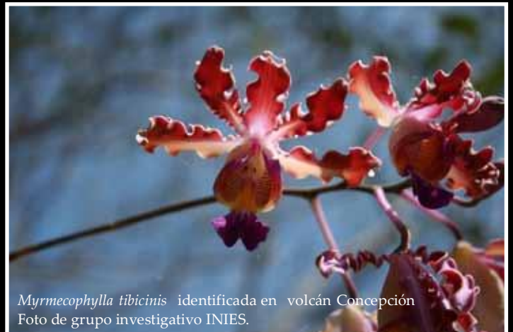
Myrmecophylla tibicinis identificada en volcán Concepción