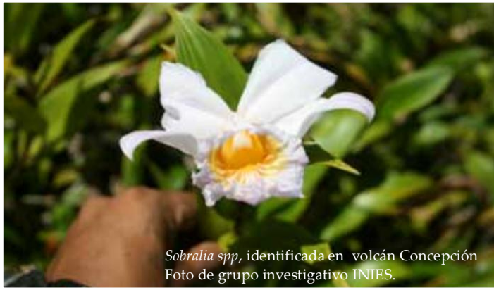
Sobralia spp. , identificada en volcán Concepción