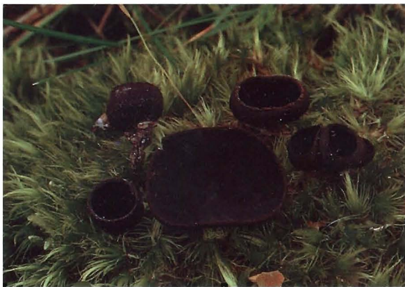
Fig. 1.- Plectania zugazae . Ascomas creciendo en ambiente húmedo, entre musgos. MA-Fungi 53068. Holotipo.

Holotypus: Hispania, Provincia Vallisoletana.