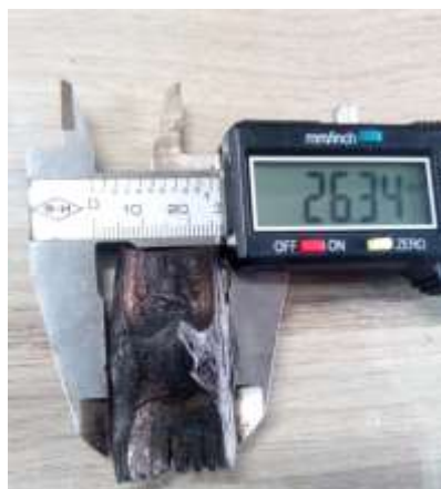
Figura 1-Carvão de Bambusa tuldooides utilizado no experimento.

Para a realização do experimento, foi utilizado carvão de Bambusa tuldooides que foi produzido na Estação Experimental Cascata da Embrapa Clima Temperado Pelotas - RS, sendo a análise termogravimétrica realizada no Centro das Engenharias – UFPel. O experimento foi realizado com três réplicas para cada amostra, as quais foram compostas por dois gramas de carvão macerado. A análise termogravimétrica foi realizada no equipamento da marca Navas Instrument modelo TGA-1000. A metodologia adotada foi manter a temperatura ambiente de 1000°C, com taxa de aquecimento de 10°C por minuto e vazão de um litro de gás nitrogênio por minuto. Para determinar a estabilidade térmica, foi realizada análise termogravimétrica de acordo com a norma ASTM e 2550-11, que consiste em medir as variações de perda de massa da amostra, devido a transformações físicas ou químicas sofridas.