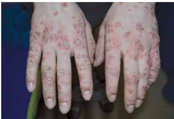
Figure 3. Numerous pustules locally in a bouquet-like pattern, erythematous changes and erosions on the dorsal surfaces of the hands

Rycina 3. Liczne krosty, miejscami o układzie bukietowatym, zmiany rumieniowe i nadżerki w obrębie grzbietów rąk