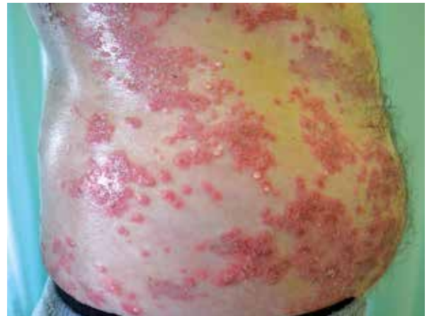
Figure 6. Numerous annular pustules with the characteristic "hypopyon" sign within the lateral areas of the trunk

Rycina 5. Zmiany rumieniowo-naciekowe w obrębie grzbietów rąk