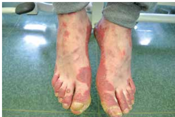
Figure 4. Confluent infiltrated erythematous lesions with peeling of the skin of the feet

Rycina 3. Liczne krosty, miejscami o układzie bukietowatym, zmiany rumieniowe i nadżerki w obrębie grzbietów rąk