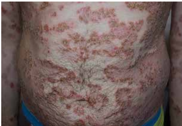
Figure 1. Extensive festoon-like erythematous lesions with individual pustules at the periphery of the skin on the trunk. The margins of lesions with the presence of serous-purulent scabs. A marked tendency for the exacerbation of lesions in the axillary regions

Rycina 1. Rozległe zmiany rumieniowe o układzie festonowatym z pojedynczymi krostami na obwodzie w obrębie skóry tułowia. Brzeźna część wykwitów z obecnością surowiczo-ropnych strupów. Zaznaczona tendencja do nasilenia zmian w obrębie pach