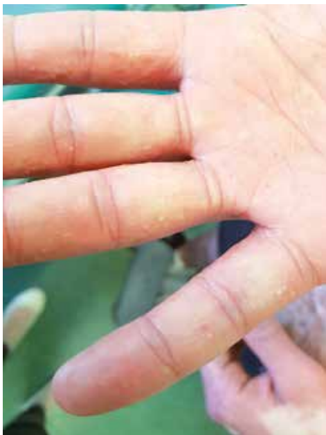
Figure 9. Individual small pustules on the palmar surfaces of the hands

Rycina 8. Zbliżenie na krosty z ryciny 7. Barwienie H+E