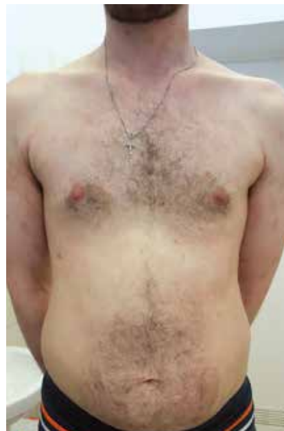
Figure 10. Slight post-inflammatory hyperpigmentation on the trunk, upper and lower extremities (skin condition after a month of systemic treatment with acitretin)

Rycina 9. Pojedyncze, drobne krosty na powierzchni dłoniowej rąk