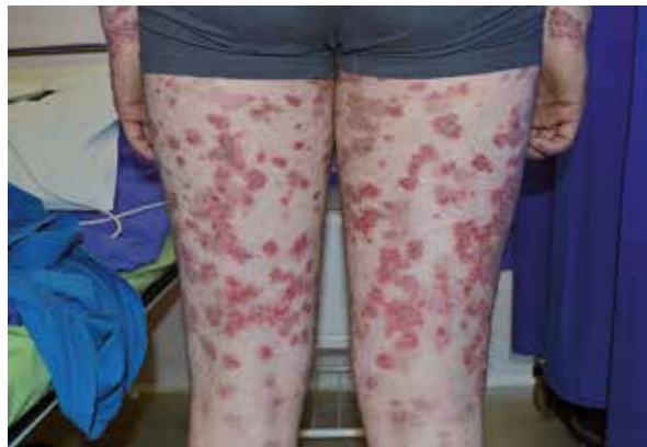
Figure 2. Lesions on the thighs Rycina 2. Zmiany w obrębie ud

Rycina 1. Rozległe zmiany rumieniowe o układzie festonowatym z pojedynczymi krostami na obwodzie w obrębie skóry tułowia. Brzeźna część wykwitów z obecnością surowiczo-ropnych strupów. Zaznaczona tendencja do nasilenia zmian w obrębie pach