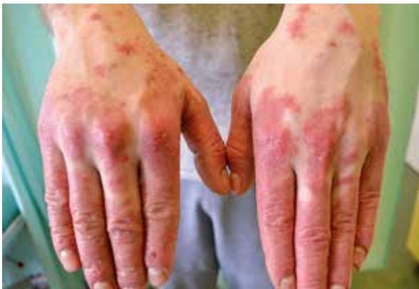
Figure 5. Infiltrated erythematous lesions on the dorsal surfaces of the hands

W oczekiwaniu na wyniki badań utrzymano dotychczasowe leczenie miejscowe i wyznaczono kolej-