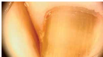
Figure 2. Dermoscopic image of the lesions presented in figure 1

Rycina 1. Przebarwienie paznokcia palca V stopy lewej