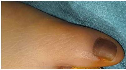
Figure 1. Hyperpigmentation of the nail of the left foot's fifth digit

Rycina 1. Przebarwienie paznokcia palca V stopy lewej