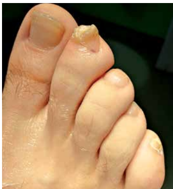
Figure 4. Hypertrophic papule on the right foot's second digit

Rycina 3. Obraz śródoperacyjny – usunięcie płytki paznokciowej i biopsja sztancowa z macierzy