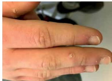
Figure 8. Periungual verrucae on the right hand

Rycina 7. Obraz śródoperacyjny – usunięcie płytki paznokciowej i elektrochirurgia łożyska paznokcia