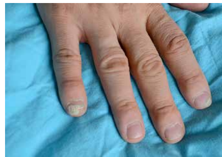
Figure 5. Subungual verrucae on the right hand's second and fifth digits

Rycina 4. Przerośnięta, hiperkeratyczna grudka na palcu II stopy prawej