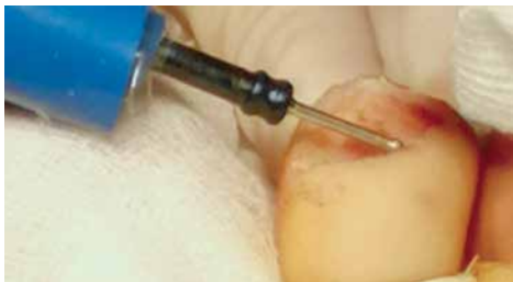
Figure 7. Intraoperative image: removal of the nail plate and electrocauterization of the nail matrix

Rycina 6. Brodawka podpaznokciowa palca III ręki lewej