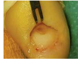
Figure 3. Intraoperative image: removal of the nail plate and biopsy from the nail matrix

Rycina 2. Obraz dermoskopowy zmian z ryciny 1