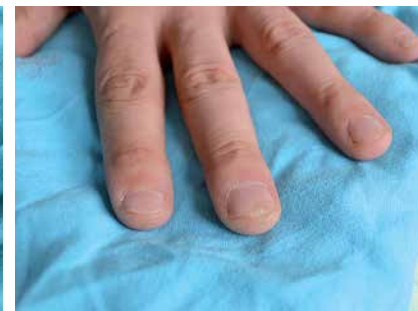
Figure 6. Subungual verruca on the left hand's third digit

Rycina 5. Brodawki podpaznokciowe palca II i V ręki prawej