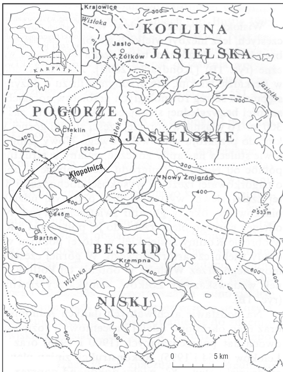
Ryc. 1. Lokalizacja obszaru badań na tle regionów fizyczno-geograficznych południowej Polski