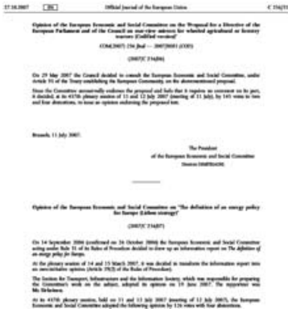
図4 EUR-Lexの検索結果からフルテキストの欧州経済社会評議会 (European Economic and Social Committee) による意見書 (Official Journal C 256 27.10.2007 p.11-) をPDF文書で入手する。