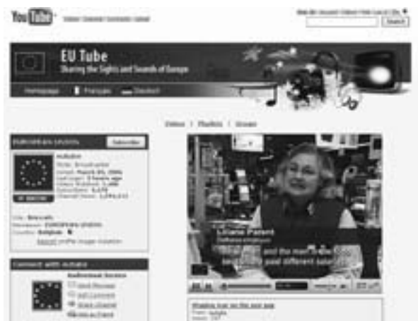
図7 EU Tube ( http://www.youtube.com/eutube ) ダジャレ的展開だが、なんとも意外な取り合わせに 奇妙な共感を覚える。

閑話休題。トレーニングセッションのプログラムの中核となるEU資料探索演習では、答案作成に十分な時間を割けない上に、パソコン上で操作実習しながらの模範解答提示とその解説があわただしく行われ、ノートに記録をとれないなど消化不良気味となったが、その内容には是非とも復習して修得し、カウンターの参考調査業務などで役立てたい探索のスキルが詰め込まれていて、充実した時間となった。