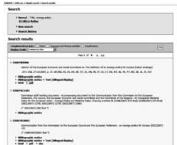
図3 EUR-Lexの検索結果一覧表示

ここで、そのうちの③「DOCUMENTS」に含まれており、EU資料で中核となる法関連文献の探索に欠かせないEU法情報のポータルサイトとなるEUR-Lexについて見ていくことにする。