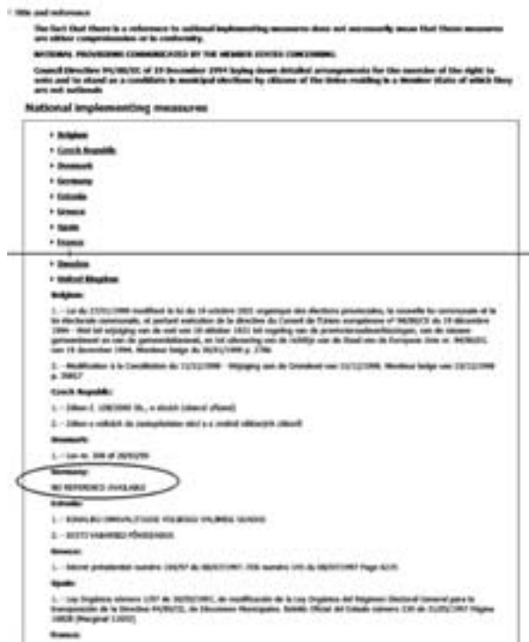
図6 EUR-Lexの検索結果中にある「MNE」（加盟国での施行状況）から情報を引き出したところ。ドイツや英国などでは「NO REFERENCE…」となっており、国内法へ置き換えていない状況が見取れる。

出してくれる。つまりデータの中にEU加盟国のつながりや同時進行性（そううまくはシンクロしないところを含めて）を確認できるような情報が加わっており、多角的に考察していく材料を与えてくれる。〔→図6〕