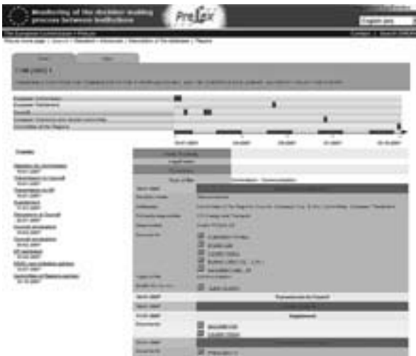
図5 PRE-Lexの検索結果の例。画面中上部に右側に棒状に伸びるグラフが時系列を示し、その上側の色付きの帯の中の青い小さな点が文書の制作された時点を示しており、そこから文書へアクセスができる。

他にもEUの情報を提供するうえで重要なサイトとして、欧州委員会統計局のEU統計情報サイトEUROSTATや、プレスリリース等のメディアへの情報発信の内容を検索できるRAPID、そして日＝EU間関係の公的情報を得ることができる駐日欧州委員会代表部のサイトなどをひとつおり紹介してもらい、次の4番目のプログラムであるEU情報の探索の実践～練習問題によるトレーニングへとつなが