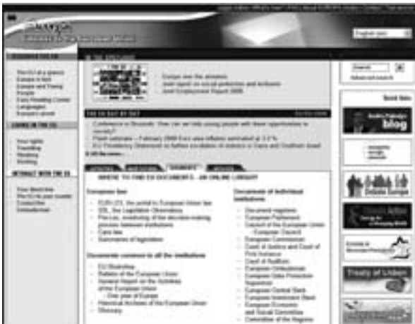
図2 「ヨーロッパサーバー」ポータル画面 URL ( http://europa.eu/ ) でEUの23公用語の一覧がある言語選択画面に入り、英語を選択することでこの画面にたどり着く。

さて、プログラムの3番目に進み、現在のネット上のEU資料にアクセスするうえで、重要な役割をする「ヨーロッパサーバー」と呼ばれるEUサイトのポータルとそのコンテンツに触れていくことになる。