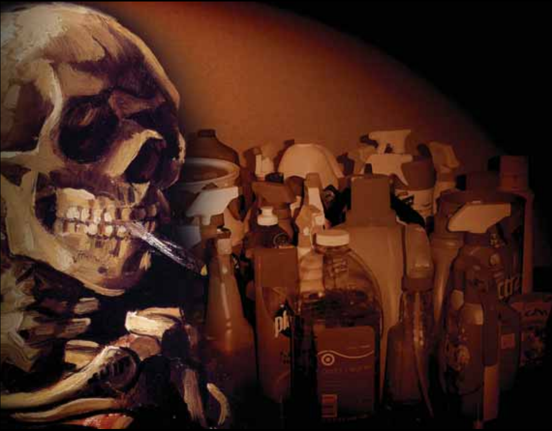
“Cráneo con cigarrillo encendido” (1885), el cuadro de Van Gogh, sobre una imagen del habitual arsenal de productos de limpieza en nuestros hogares. (Fotomontaje: Fernando de Miguel)

Sería imposible resumir los numerosos trabajos científicos que se realizan al respecto. Son investigaciones que nos indican que ciertos compuestos perfluorados, del mismo grupo de los presentes en sartenes antiadherentes, tejidos que repelen el agua o las manchas, etc., podrían estar asociados a la dificultad de una mujer para quedar embarazada; que algunas sustancias ignífugas con las que hemos bañado los sofás, los plásticos o las cortinas acaban apareciendo en los animales del Ártico y, por supuesto, en nuestros cuerpos, y podrían tener que ver con ciertos desarreglos en el aprendizaje de los niños o con algunos cánceres; que el bisfenol A, compuesto presente en el plástico policarbonato, que se encuentra, por ejemplo, en biberones, empastes dentarios o revestimiento de latas de comida, ha sido asociado con diversos problemas que van de las reacciones alérgicas a la diabetes, con problemas cardiovasculares o el cáncer de mama, entre otras cosas; que los ftala-