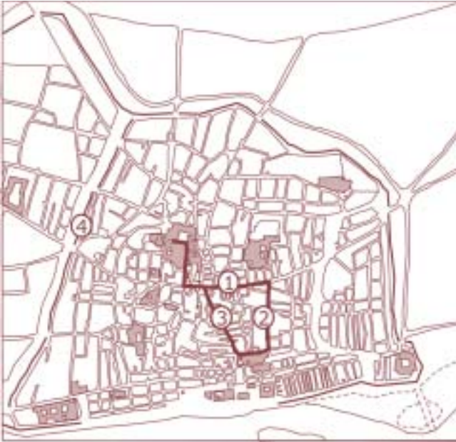
Fig. 2. La processó del Corpus a la Barcelona del segle XIV: 1. Carrer de la Bòria; 2. Carrer Montcada; 3. Carrer Argenteria; 4. Traçat de la muralla del segle XIII.