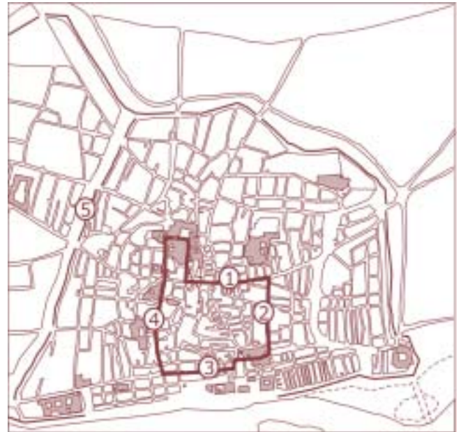
Fig. 3. La processó del Corpus a la Barcelona del segle XV: 1. Carrer de la Bòria; 2. Carrer Montcada; 3. Carrer Ample; 4. Carrer de Regomir; 5. Traçat de la muralla del segle XIII.