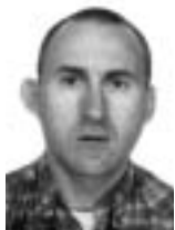
Miguel Raufast Chico 1 Institució Milà i Fontanals, CSIC, Barcelona.

Mitjançant l'estudi dels itineraris processionals de la Barcelona dels segles XIV i XV, aquest treball intenta reconstruir i identificar els espais físics urbans dibuixats per la festivitat i l'espiritualitat baixmedievals. Utilitzant informació arxivística inèdita de l'època, s'intenta descriure la xarxa viària processional de la ciutat i, alhora, reflexionar sobre el seu significat, no només religiós, sinó també social i polític.