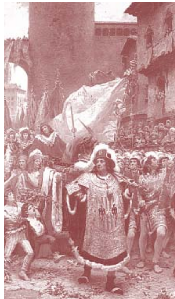
Evocació idealitzada de l'entrada del príncep de Viana a Barcelona l'any 1461. Detall de l'obra de Ramon Tusquets, 1886.

moire l'agitació popular o el descontrol social dins de la ciutat–, l'experiència d'anteriors seqüències sísmiques a Barcelona aconsellava ara, per precaució, evitar una manifestació processional d'aquestes característiques: "...com per semblant cas de terratrèmol en lo passat se féu processó general e foren en la església del monastir de Sant Agostí, fou terratrèmol e fou feta gran remor entre la gent, e per aquesta rahó fou deliberat que no és espedient, en alguna forma, que processó general sia feta." 34