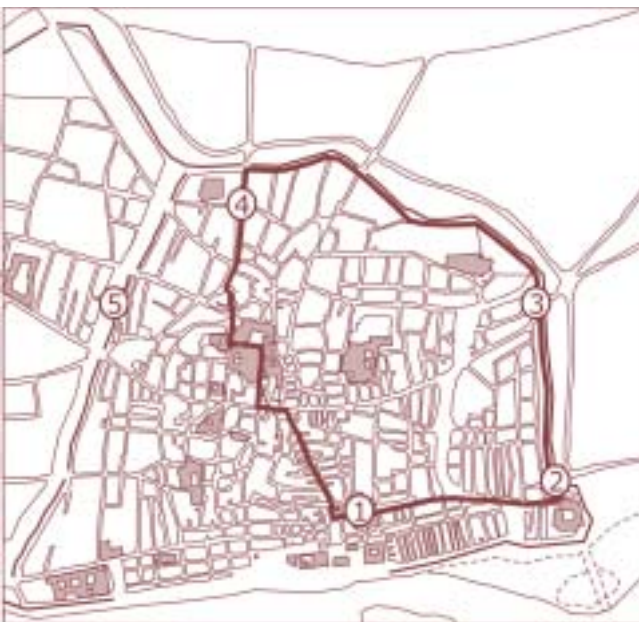
Fig. 4. Reconstrucció aproximada de la processó per epidèmia de pesta a Barcelona el 1348: 1. Santa Maria del Mar; 2. Portal de Sant Daniel; 3. Portal Nou; 4. Plaça de Santa Anna; 5. Traçat de la muralla del segle XIII.