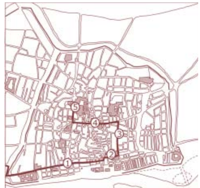
Fig. 5. Entrada reial de Joan II a Barcelona el 1458: 1. Carrer Ample; 2. Santa Maria del Mar; 3. Carrer Montcada; 4. Carrer de la Bòria; 5. Catedral.