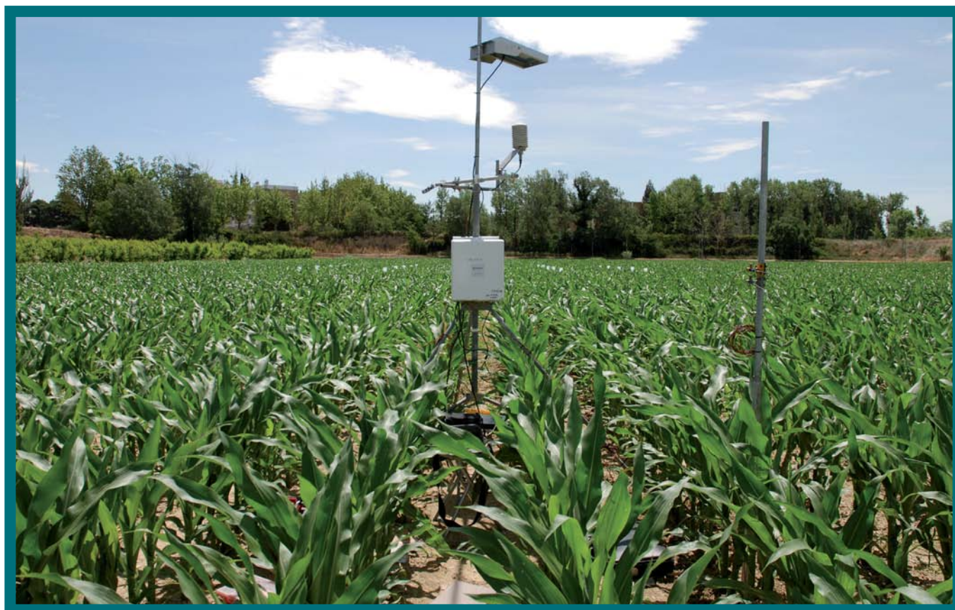
Foto 1. Vista del ensayo EEAD.