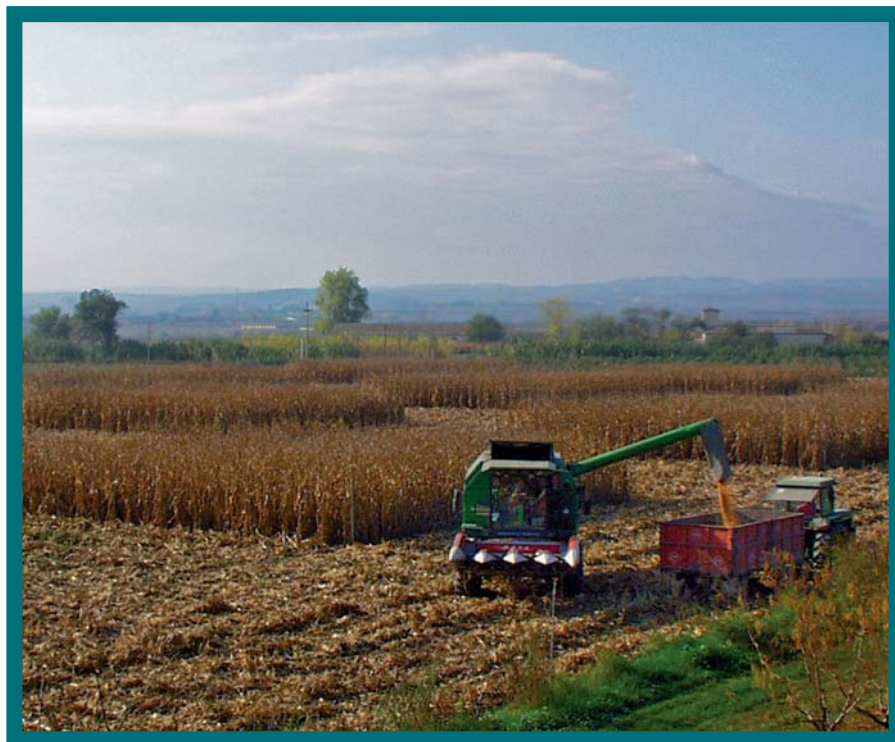
Foto 2. Vista del ensayo EEAD en cosecha.

mente el conjunto de estas reducciones fue la causa del menor rendimiento. Asimismo, se observó una menor altura de las plantas de maíz con el riego diurno, siendo la diferencia significativa en uno de los años.