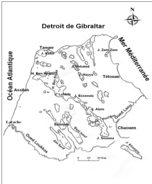
Figure 1. Carte des formations gréseuses de la Péninsule Tingitane avec le nom des montagnes les plus importantes. Les étoiles montrent la localisation des zones où l'échantillonnage a été réalisé. Carte adaptée d'après Seuter (1980). Mapa de las formaciones de arenisca con los nombres de las montañas más importantes. Localización de las muestras de bosque en asterisco. Basado en Seuter (1980).

ci est localisée au nord du Maroc entre les latitudes 35° 00' et 35° 55' N et les longitudes 5° 00' et 6° 15'. Les hautes crêtes sont situées à l'ouest de la ville de Chaouen: Jbel Khezana (1705 m), J. Bouhachem (1681 m) et J. Sounna (1603 m) (fig. 1).