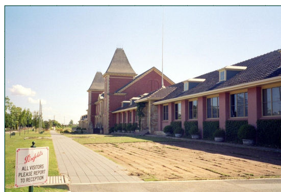
Adegas Penfolds en Barossa Valley

En Australia existen preto de 1900 adegas que vendimaron na colleita 2004, 1860 millóns de kilos de uva (Táboa 2), obtendo 14 millóns de hectolitros de viño (preto dunha terceira parte da produción de viño en España). Destacar o aumento próximo ao 35% na produción de viño respecto ao ano 2003. É importante subliñar que o rendemento medio de uva por hectárea é de 11.300 Kg/ha, é dicir, máis do duplo do rendemento medio español.