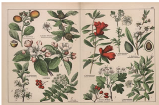
Lámina interior N. Registro [000775059]

Redacción del informe final del Proyecto (en nuestro caso el Proyecto PAD 0016).