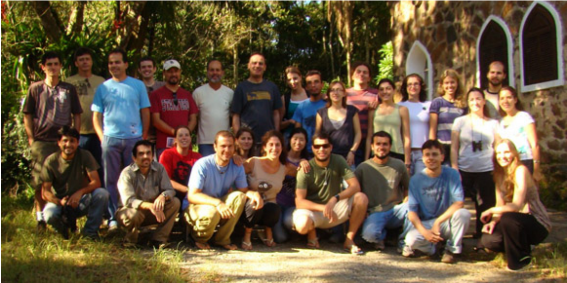
Figura 3. Foto de grupo de los asistentes al VII Curso Latino Americano de Frugivoria e Dispersão de Sementes, 2010. Parque Estadual Intervales, SP, Brasil; 10 Marzo 2010.