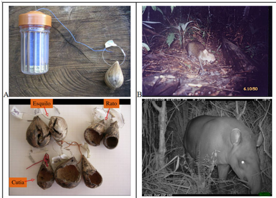
Figura 2. A , realizamos prácticas de campo con experimentos de remoción de semillas de varias especies de palmeras, a fin de estudiar los patrones de dispersión por roedores como agutíes. B , instalamos cámaras-trampa para estudiar la visita de frugívoros a varias especies de árboles y complementar las observaciones directas.