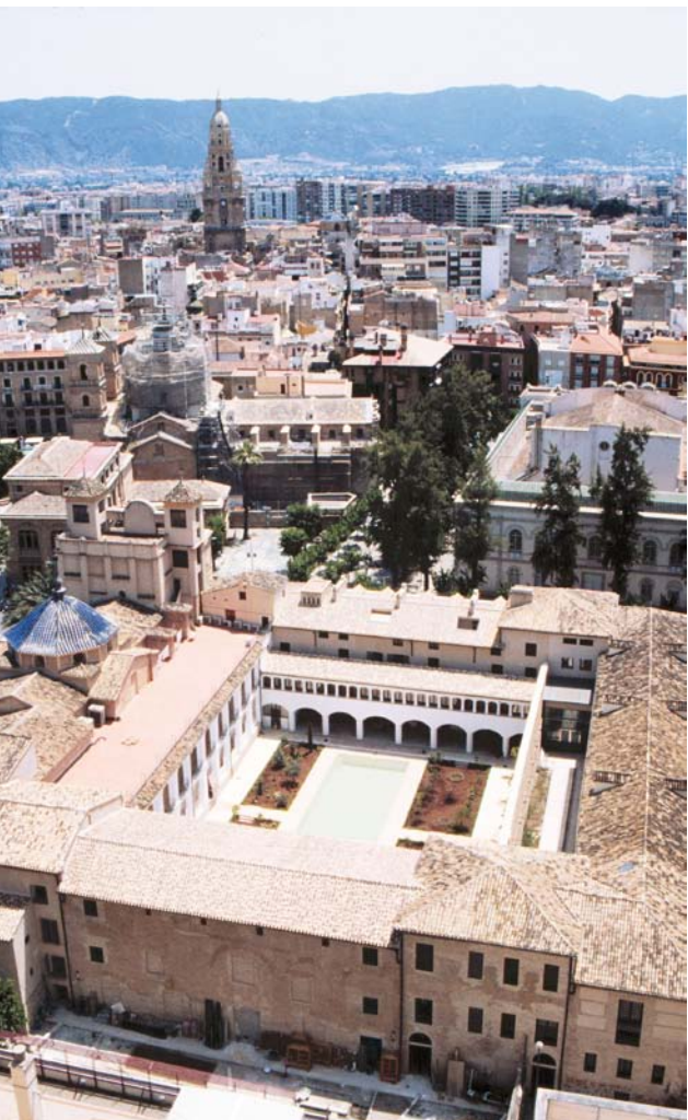
2 - Vista aérea del Monasterio de Santa Clara la Real de Murcia desde el norte.

investigadores coinciden en que los restos palatinos con jardín de crucero existentes bajo el edificio del siglo XIII es ad-Dâr as-Sugrà .