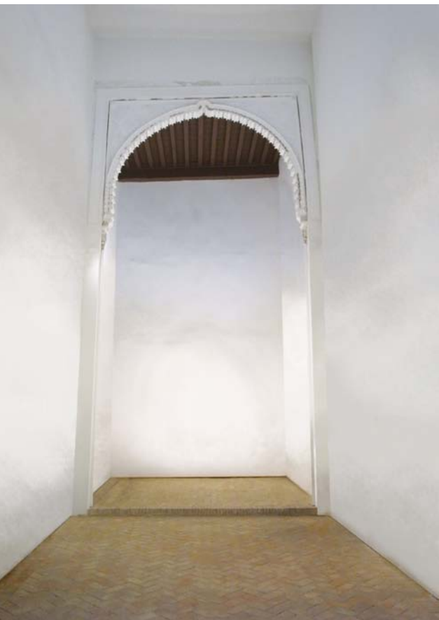
5 - Al fondo la alhania occidental del salón septentrional del palacio del siglo XIII.