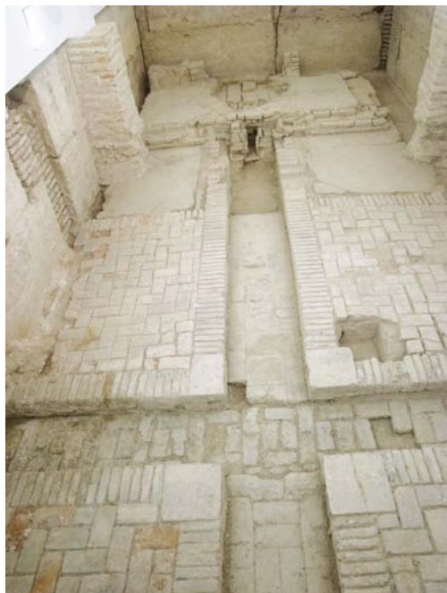
6 - Crucero del palacio del siglo XII.

histórico de la Murcia de ese período nos inclinamos entonces por fechar la construcción del palacio durante el emirato de Ibn Hûd al-Mutawakkil (1228-1238) y más concretamente por los primeros años de la década de los treinta, coincidiendo con el momento de mayor protagonismo de Murcia durante el siglo XIII.