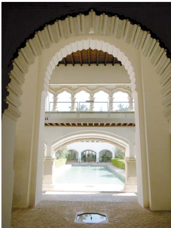
4 - Vista del patio desde el interior del salón septentrional del palacio del siglo XIII.

por lo que sólo puede tratarse del edificio principal del Alcázar Menor, el que actualmente forma parte del convento de Santa Clara, mientras que todo lo situado a oriente de dicha línea ya conformaba otra u otras propiedades, entre las que se encontraba la concedida a los dominicos por Jaime I.