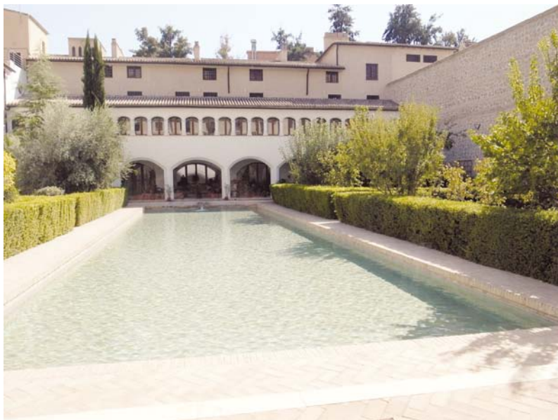
3 - Gran alberca del palacio del siglo XIII.

El nuevo monasterio se dispuso en el espacio situado a occidente de la plaza del mercado que corresponde parcialmente con la actual de Santo Domingo. Los límites de este espacio comercial fueron establecidos el 5 de mayo de 1272 de la siguiente manera: “otorgamosles la plaça que se tiene con la plaça de las nuestras casas de la Arrixaca et ua fasta el muro de la Arrixaca de los cristianos, e deste muro ua por la açequia mayor de la villa que passa ante las casas de los freyres menores, et torna por el huerto de don Gregorio, et uiene fasta el muro de la villa et ua el muro arriba fasta las puertas nuevas que son en la rua