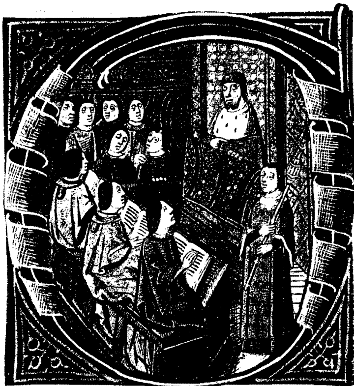
Lectura de medicina en una aula universitària. Caplletra il·luminada d'un manuscrit amb obres de Galè copiat vers 1460 (Dresden, Sächsische Landesbibliothek, ms. Db 93, fol. 503v).