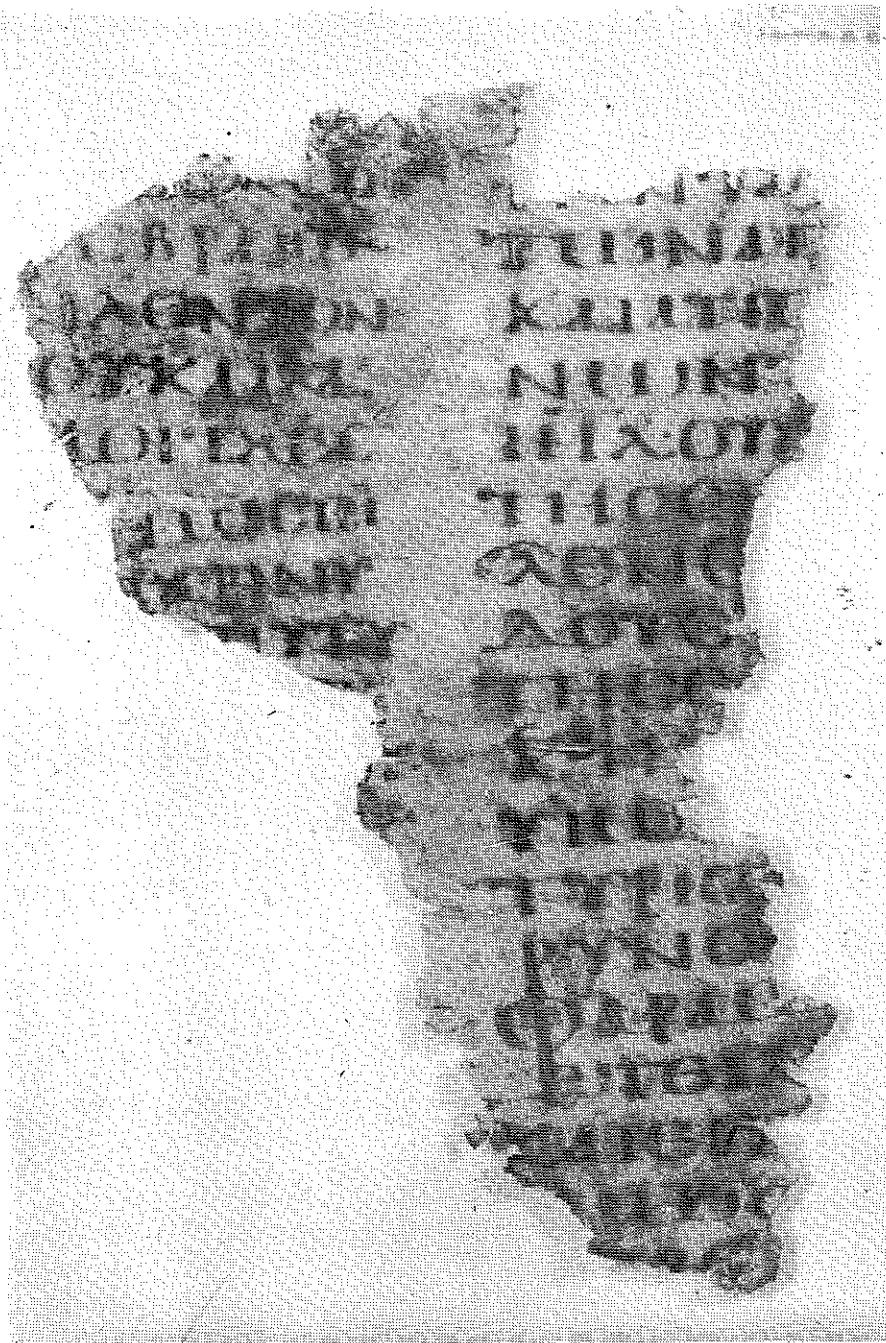
Ms. Gr. Bibl. f. 4 (p) v