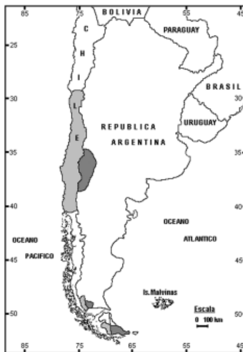
Fig. 1. Distribución actual del conejo europeo en Sudamérica (el área gris clara corresponde a Chile y la gris oscura a la Argentina).

La velocidad promedio de dispersión de esta especie fue de 16 km/año en Nueva Zelanda (Flux 1994), lo cual resulta ligeramente superior a los 10 km/año que se observó en Argen-