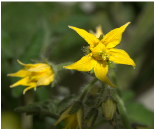
Figur 2. Litt resting av planten fremmer, at pollen fra støvbladane frigjøres og spres.