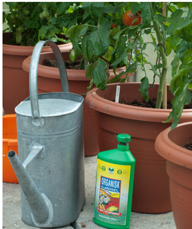
Figur 1. Minst halvparten av nitrogeninnholdet i gjødselsmedlat må være av økologisk opprinnelse.

En småplante trenger to til tre dl vann om dagen først på året. En fullvokst plante to til tre liter på en varm sommerdag (Bø & Fritsvold 2001). Behovet for vann har sammenheng med lys innstråling og må reguleres deretter. Vanning må skje i tidsrommet fra to timer før soloppgang og inntil to timer før solnedgang. Plantene skal av hensyn til sopp og lav temperatur være tørket innen natten (Hansson et. al. 2007). Hvis det samles opp regnvann til vanning må en samtidig være oppmerksom på forsyning med særlig kalsium. Kalsium opptas via vann, men regnvann inneholder mindre enn grunnvann. Kalsium kan tilføres om våren med skjellsand eller dolomittkalk. Det frigis sakte. Mangel på kalsium viser seg ved griffelrâte (Hansson et. al. 2007).