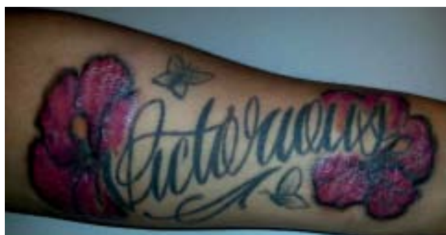
Figuur 1. Scherp begrensde rood-paarse, squameuze plaques in specifieke delen van een tatoeage op de linker onderarm.

Tatoeages zijn cosmetische versieringen van de huid die we steeds vaker om ons heen zien. Desondanks is dat niet zonder risico op complicaties. Wij presenteren een patiënte die een granulomateuze reactie ontwikkelde in specifieke delen van haar tatoeage, jaren nadat deze was geplaatst. Wegens een co-existente panuveïtis werd de diagnose sarcoïdose overwogen.