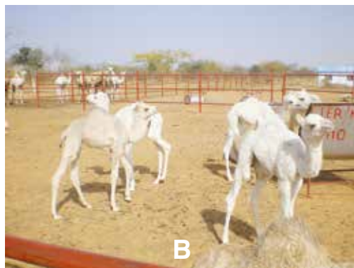
Photo 1 : Dromadaire femelle, mâle et chamelons pour le prélèvement de sang