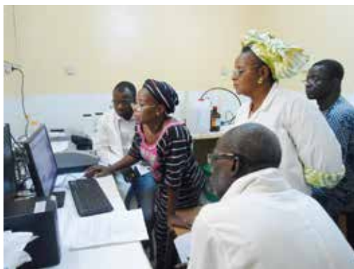
Photo 3 : Formation du personnel sur les techniques d'analyses du sang