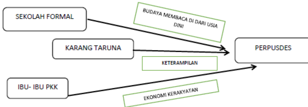
Gambar 2.1. Rancang Bangun Strategi Aksi

Untuk mencapai kondisi yang diharapkan sebagaimana yang dijelaskan di depan, dibutuhkan beberapa strategi khusus yang gambarnya sebagai berikut: