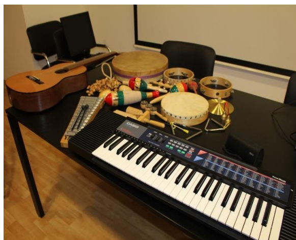
Figura 2. Instrumentos utilizados nas sessões de musicoterapia

Os instrumentos musicais utilizados nas sessões incluíam um teclado sintetizador e uma guitarra como instrumentos harmónicos. Os restantes instrumentos pertenciam à família da percussão: tamborim, pandeireta, maracas, címbalos, guizeira, soalha de mão, triângulo, bloco de dois sons, clavas, reco-reco, castanholas, ocean drum , pau de chuva, shaker , eggs , entre outros.