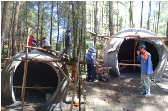
Gambar 3. Pembangunan Eco-Smart Mini Lab

Pada Gambar 2 ditunjukkan bahwa proses awal pembangunan Eco-Smart Mini Lab yaitu penggalian tanah. Pada tahap ini, tanah digali untuk membuat pondasi awal. Selanjutnya, dilakukan proses pembangunan bangunan Eco-Smart Mini Lab ditunjukkan pada Gambar 3.