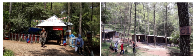
Gambar 1. Dokumentasi Tim Pelaksana di Bumi Perkemahan Bedengan

Bumi perkemahan Bedengan terletak di kecamatan dau tepatnya di Desa Selorejo Kecamatan Dau, Kabupaten Malang, Jawa Timur. Berdasarkan observasi yang dilakukan tim pelaksana, wahana utamanya berupa area perkemahan yang dikelilingi oleh pepohonan dan beberapa perbukitan. Pada area tersebut, jumlah tenaga kerja yang terlibat sekitar 20 orang yang meliputi penjaga parkir, tukang bersih-bersih, petugas keamanan, hingga beberapa pedagang kaki lima. Secara pemasukan ke desa, omzet yang dihasilkan kurang lebih 30 juta/bulan. Wisatawan berasal dari wilayah jawa timur sebagian kecil dari luar Jawa Timur Berdasarkan hasil observasi Tim yang telah dilakukan kepada pelaku industri pariwisata di Bedengan didapatkan hasil yang menyatakan bahwa masyarakat pelaku industri masih bingung inovasi apa yang tepat untuk diterapkan dikawasan wisata yang tentunya juga yang sedang trend di masa kini. Dokumentasi yang dilakukan oleh tim pelaksana PNBP 2020 disajikan pada Gambar 1.