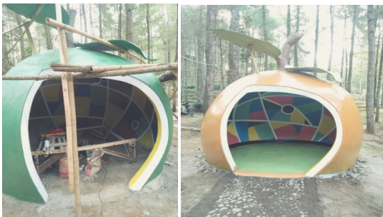
Gambar 4. Proses Finishing Eco-Smart Mini Lab

Pada Gambar 3 ditunjukkan proses lanjutan pembangunan bangunan Eco-Smart Mini Lab. Proses pembangunan dilakukan oleh 4 orang tukang dan 1 orang warga sekitar. Selanjutnya, proses finishing ditunjukkan pada Gambar 4.