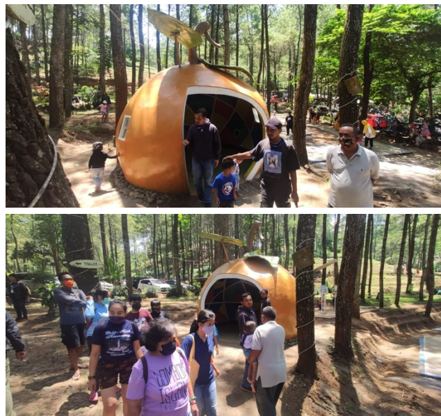
Gambar 5. Sosialisasi Eco-Smart Mini Lab

kegiatan sosialisasi bangunan Eco-Smart Mini Lab kepada para wisatawan ditunjukkan Gambar 5.