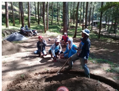
Gambar 2. Proses Awal Penggalian Tanah

Pada tahapan ini, pelaksanaan diawali dengan membuat desain fixed dari Eco-Smart Mini Lab . Proses desain dilakukan oleh tim pelaksana. Penentuan desain fixed dengan mengacu pada kondisi tanah dan letak Eco-Smart Mini Lab akan dibangun.